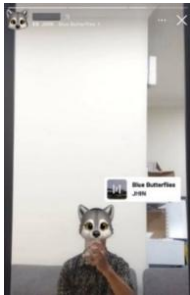
Mengunggah Foto Pasangan Virtual di Instagram Story

Subjek L mengunggah foto pasangan virtualnya menggunakan fitur di Instagram Story . Subjek L mengunggahnya sebagai bentuk menciptakan momen bersama pasangan virtualnya. Dalam gambar subjek L menggunakan foto pasangan virtualnya diiringi dengan musik romantis. Tidak hanya itu, subjek L juga menyebut akun media sosial pasangannya agar memudahkan pasangan virtual me-repost Instagram Story tersebut.