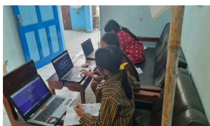
Gambar 2. Uji tes media Quizizz

Selain itu, pengumpulan teori yang dilakukan mengacu pada teori perkembangan kognitif anak oleh Piaget, di mana peserta didik kelas IV yang berusia sekitar 9-10 tahun seharusnya berada dalam tahap operasional konkret. Namun, tidak semua peserta didik telah mencapai tahap tersebut, sehingga mereka membutuhkan pendekatan yang sesuai untuk membantu mereka memahami materi matematika (Santosa, 2024). Berdasarkan teori ini dan hasil wawancara, peneliti merancang ide solusi berupa penggunaan media interaktif, seperti Quizizz , yang dapat meningkatkan minat dan pemahaman peserta didik melalui permainan edukatif berbasis digital (Ramadhan, 2024). Dalam tahap selanjutnya, peneliti merancang prototype menggunakan media Quizizz sebagai alat bantu pembelajaran untuk mengatasi kesulitan peserta didik dalam mempelajari operasi bilangan bulat. Tes yang dilakukan pada 7 November 2024 akan mengukur efektivitas media ini terhadap pemahaman matematika peserta didik kelas IV.