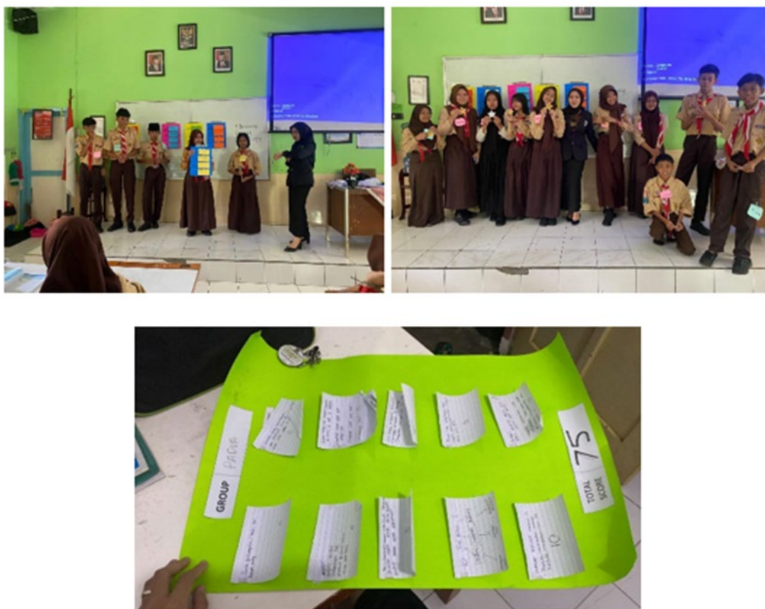
Gambar 5. Tahap Penghargaan Kelompok

Kelima, tahap penghargaan kelompok ( Team Recognition ) mengakui prestasi kelompok yang mencapai skor tertinggi dan menyelesaikan permainan dengan waktu tercepat. Pembahasan bersama sebelum penentuan pemenang juga memungkinkan peserta didik untuk saling belajar dari satu sama lain. Tahap ini menjadi penutup yang membangkitkan semangat kompetitif sekaligus kolaboratif di antara peserta didik. Dengan pendekatan diferensiasi yang terlihat melalui diferensiasi konten dan proses, model pembelajaran Kooperatif Tipe TGT memungkinkan guru untuk memfasilitasi pengalaman belajar yang sesuai dengan kebutuhan dan preferensi belajar peserta didik. Dengan menggunakan media pembelajaran interaktif dan aktivitas TGT yang melibatkan soal berjenjang, model ini dapat mengakomodasi berbagai gaya belajar dan tingkat kemampuan peserta didik, serta memastikan pembelajaran bermakna yang melampaui batas kelas.