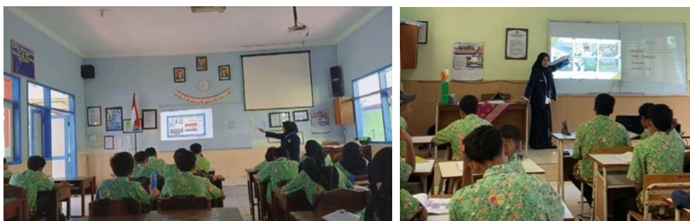
Gambar 2. Tahap penyajian kelas

Tahap kedua dalam implementasi pendekatan pembelajaran berdiferensiasi melalui model pembelajaran Kooperatif Learning Tipe TGT terdiri dari lima sintak pembelajaran yang memainkan peran penting dalam memfasilitasi proses belajar mengajar yang berorientasi pada keberagaman peserta didik. Pertama, pada tahap penyajian kelas ( Class Presentation ), guru memulai dengan menyampaikan pertanyaan pemantik untuk membangkitkan minat dan keterlibatan peserta didik. Setelahnya, materi pembelajaran disampaikan melalui media PPT interaktif yang dirancang untuk memfasilitasi pengalaman belajar yang menyeluruh. Dalam penyampaian materi, terdapat sisipan aktivitas analisis dan tanya jawab yang memungkinkan peserta didik untuk berpartisipasi aktif dan mengeksplorasi materi lebih dalam, sesuai dengan gaya belajar dan tingkat pemahaman mereka. Misalnya, peserta didik diajak untuk menganalisis gambar kontekstual yang relevan dengan lingkungan sekitar mereka atau menjawab soal kuis berbasis permainan melalui platform digital seperti Wordwall.