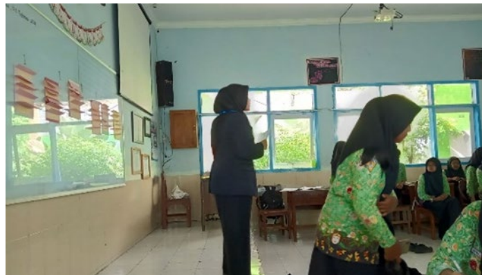
Gambar 3. Tahap permainan berupa penjelasan instruksi

Ketiga, tahap permainan ( Games ) dimulai dengan penjelasan instruksi permainan yang jelas oleh guru. Setiap kelompok berlomba-lomba dalam berdiskusi untuk menyelesaikan soal berjenjang yang disajikan pada papan tulis. Soal-soal tersebut dirancang dengan tingkat kesulitan yang bervariasi, mulai dari level terendah hingga tertinggi, sehingga dapat mengakomodasi berbagai tingkat kemampuan peserta didik. Peserta didik diberi kebebasan untuk menggunakan sumber daya yang tersedia, seperti buku paket dan catatan bahan ajar, dalam menyelesaikan soal.