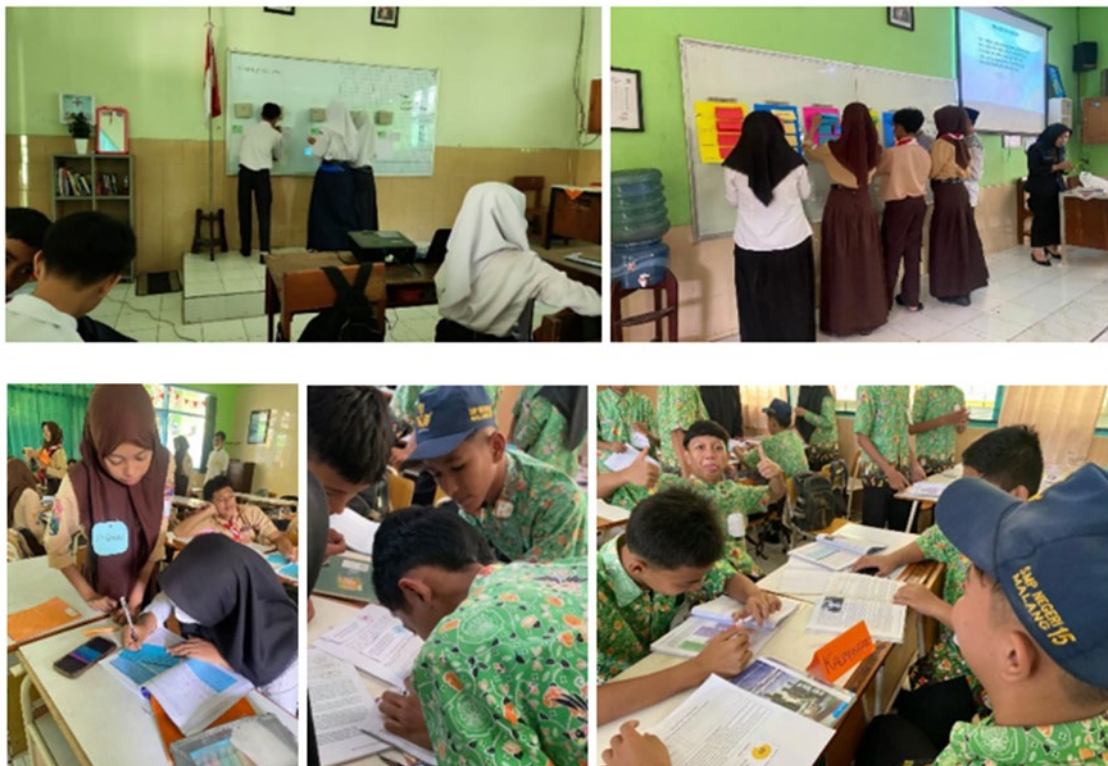
Gambar 4. Tahap Turnamen