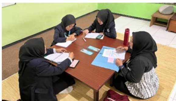
Gambar 6. Refleksi dan Evaluasi bersama GP dan Rekan Sejawat

Guru juga memberikan penguatan terhadap pembelajaran yang telah dilakukan pada hari tersebut. Selain itu, guru menjelaskan mengenai aktivitas yang akan dilakukan pada pembelajaran berikutnya, memberikan gambaran tentang topik atau materi yang akan disampaikan serta harapan-harapan untuk pembelajaran selanjutnya. Penutup pembelajaran dilakukan dengan doa bersama, menandakan bahwa pembelajaran telah berakhir dengan baik dan memberikan kesempatan bagi peserta didik dan guru untuk merenung dan bersyukur atas pengalaman belajar yang telah mereka jalani bersama.