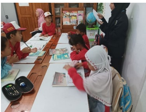
Gambar 2. Implementasi pembelajaran berdiferensiasi di SDN Lowokwaru 5