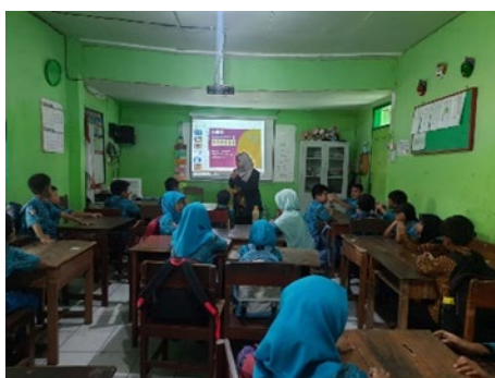
Gambar 1. Implementasi pembelajaran berdiferensiasi di SDN Lowokwaru 4

dengan cara observasi di lingkungan sekolah, anak auditori belajar dengan mengamati video, anak visual mengamati gambar. Sementara dalam diferensiasi proses, narasumber mengelompokkan anak yang mahir, berkembang, dan kesulitan memahami materi dalam satu kelompok. Hal tersebut bertujuan untuk membantu teman sejawat agar siswa dapat saling berkolaborasi. Dan untuk diferensiasi produk yang dilakukan narasumber yaitu dengan memberikan LKPD yang berbeda agar siswa dapat mengekspresikan materi yang diajarkan sesuai dengan potensi dan kebutuhannya. Hasil dari pembelajaran berdiferensiasi yang telah dilakukan oleh narasumber adalah siswa menjadi lebih aktif dalam proses pembelajaran dan memahami materi dengan baik. Tantangan yang dihadapi oleh narasumber dalam penerapan pembelajaran berdiferensiasi adalah pembuatan LKPD yang berbeda disesuaikan dengan gaya belajar dan minat siswa dan tantangan dalam memahami karakteristik siswa yang berbeda-beda. Narasumber berpendapat bahwa pembelajaran berdiferensiasi dapat digunakan sebagai strategi pemenuhan kebutuhan belajar siswa karena pembelajaran berdiferensiasi dilakukan berdasarkan kebutuhan belajar dan minat siswa.