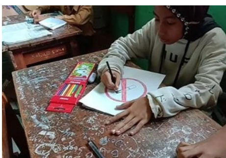
Gambar 3. Implementasi pembelajaran berdiferensiasi di SDN Bandungrejosari 2