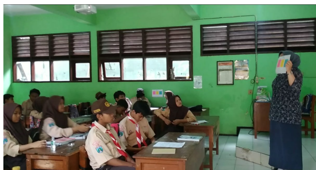
Gambar 3. Penjelasan Media Pembelajaran Dinding Cerita