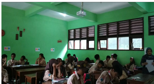
Gambar 2. Pelaksanaan Pembelajaran

Tahap pertama merupakan tahap persiapan, pada tahap ini peneliti mempersiapkan keperluan yang akan digunakan pada pembelajaran model TGT. Keperluan-keperluan yang dipersiapkan adalah modul ajar, media pembelajaran, dan LKPD. Dalam penyusunan modul ajar, peneliti menentukan tujuan pembelajaran, asesmen, dan langkah-langkah pembelajaran. Sedangkan materi pembelajaran yang telah ditentukan adalah Lembaga Keuangan Bank. Media pembelajaran yang dapat mendukung pelaksanaan TGT adalah "Dinding Cerita" yang telah dikembangkan oleh peneliti. Dinding Cerita merupakan media pembelajaran yang dapat diakses oleh peserta didik melalui dinding-dinding yang ada di kelas. Dalam Dinding Cerita terdapat tiga kotak dengan warna berbeda yang berisi pertanyaan-pertanyaan seputar Lembaga Keuangan Bank, yang mana Dinding Cerita akan digunakan saat tahap tournament .