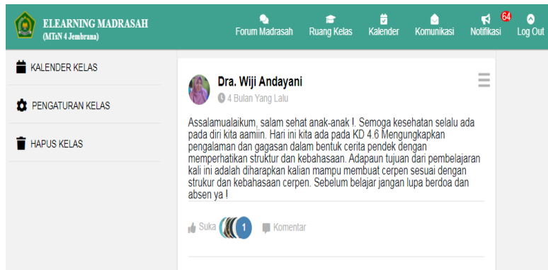
Gambar 1. Tahapan kegiatan pendahuluan pembelajaran

pembelajaran menulis teks cerita pendek dan menyampaikan tujuan kegiatan pembelajaran menulis teks cerita pendek. Pendidik perulah melaksanakan kegiatan pendahuluan untuk menyiapkan fisik dan psikis peserta didik dalam mengikuti kegiatan pembelajaran (Isdisusilo, 2012). Sejalan dengan pendapat tersebut, pendidik juga menyiapkan fisik dan psikis peserta didik sebelum memulai kegiatan pembelajaran menulis teks cerita pendek. Pendidik mengigatkan peserta didik untuk berdoa dan mengisi daftar kehadiran melalui e-learning madrasah. Pada pertemuan ke-12 dapat diketahui seluruh peserta didik kelas IX-A sebanyak 29 peserta didik mengisi daftar hadir yang terdapat di e-learning madrasah.