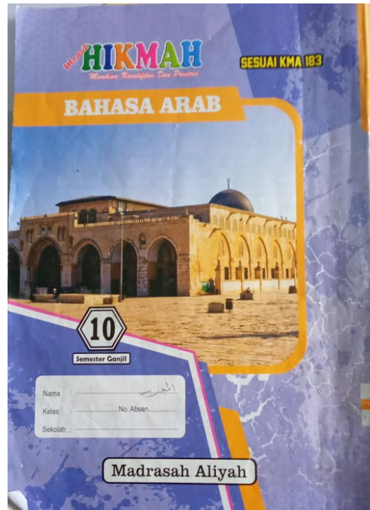
Gambar 2. Lembar Kerja Siswa (LKS)

Selanjutnya Sesuai hasil observasi lapangan pada tanggal 12 november 2022 bahan ajar di MAN 1 Lampung Tengah menggunakan Lembar kerja siswa (LKS) sebagai pegangan siswa dan guru dalam pembelajaran. Materi yang terdapat di LKS tidak begitu lengkap karena didalam LKS adalah rangkuman materi pembelajaran. Akan tetapi, LKS tersebut dapat menunjang siswa dalam pembelajaran bahasa Arab. Berikut LKS yang digunakan didalam pembelajaran (Gambar 2).