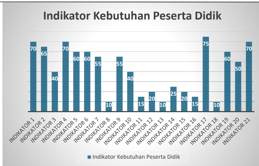
Gambar 2. Indikator Kebutuhan Peserta Didik

Hasil yang didapat dari analisis ini dilihat dari nilai pengetahuan peserta didik di SMAN 1 Solok Selatan, yaitu data penilaian akhir semester dengan nilai rata-rata 68,78. Nilai hasil belajar tersebut menunjukkan bahwa kemampuan berpikir kritis tergolong rendah yang didapatkan dari hasil belajar peserta didik yang menunjukkan bahwa rata-rata masih dibawah 78 yaitu belum mencapai kriteria ketuntasan minimum. Nilai hasil belajar tersebut mengindikasikan bahwa kemampuan berpikir kritis peserta didik tergolong rendah. Perbandingan hasil belajar peserta didik dapat dilihat pada Tabel 1 berikut.