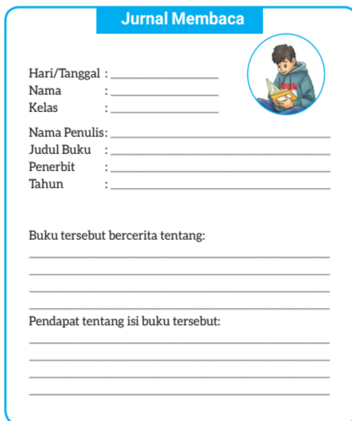
Gambar 1. Jurnal Baca Literasi

Meskipun lingkungan belajar di kelas telah mendukung kegiatan literasi, namun keterbatasan sumber bacaan, terutama dalam hal variasi dan jumlah menjadi kendala utama. Hal ini menyebabkan minat siswa terhadap literasi menjadi kurang, sehingga implementasi kegiatan literasi yang dilakukan terlihat kurang efektif dalam menanamkan budaya literasi. Meskipun kegiatan literasi di sekolah telah dilakukan setiap pagi, namun masih kurangnya pemantauan dan kegiatan reflektif menyebabkan peserta didik belum sepenuhnya memahami kebermaknaan dan manfaat dari kegiatan literasi tersebut.