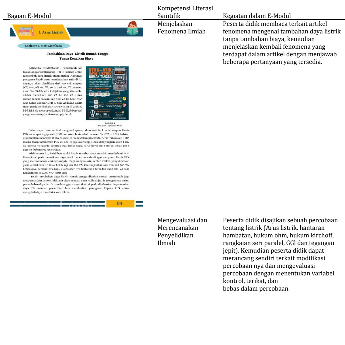
Tabel 5. Tampilan E-Modul

Aspek kompetensi literasi saintifik yang terdapat dalam E-Modul mengacu pada kerangka kerjas PISA 2018 yang terdiri dari tiga kompetensi, yakni: (1) Menjelaskan fenomena secara ilmiah, (2) Mengevaluasi dan merancang penyelidikan ilmiah, dan (3) Menginterpretasi data dan bukti secara ilmiah (OECD, 2019). Dalam setiap sub bab E-Modul terdapat 3 aspek yang termuat yakni tersedia dalam kegiatan pembelajarannya yang memfasilitasi kompetensi literasi saintifik. Pada kegiatan “ Mari Membaca ” pada sub bab I , “ Mari Mengeksplorasi ” pada sub bab II, “ Mari Mengaplikasikan ” pada sub bab III yakni kegiatan 4c dan 4d serta pada sub bab IV 4a (1) dan 4b (1) dapat memfasilitasi aspek kompetensi menjelaskan fenomena secara ilmiah. Peserta didik dapat termotivasi untuk menemukan fakta dan memperluas pengetahuan mereka dengan terlibat dalam kegiatan mengamati dan menjelaskan fenomena ilmiah (Asyhari dan Hartati, 2015). Pada setiap sub bab disajikan sebuah fenomena sehingga peserta didik dapat menjelaskan terkait fenomena-fenomena yang tersedia dengan menjawab beberapa pertanyaan yang tersedia pada Tabel 5.