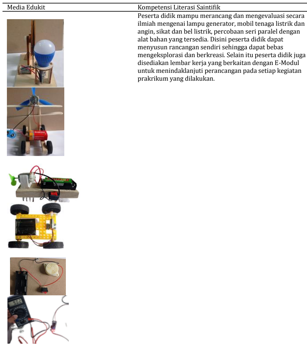
Tabel 6. Media Edukit

Listrik, d) Edukit Pemanfaatan Energi Listrik. Edukit yang dikembangkan ini diklaim sebagai fasilitator literasi saintifik karena pada kegiatan pembelajaran menggunakan edukit peserta didik dapat turut serta melakukan kegiatan praktikum seperti menyusun dan merancang sendiri praktikum sesuai dengan petunjuk dan lembar kerja pada modul. Disini peserta didik dapat mengevaluasi kegiatan praktikum nya dengan menentukan berbagai variabel dalam praktikum dan juga merancang sesuai dengan permintaan pada lembar kerja yang menkontruksikan peserta didik untuk dapat merancang sendiri kegiatan praktikum nya. Berbagai media dan kegiatan praktikum dapat ditunjukkan pada tabel 6.