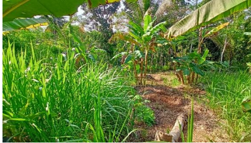
Gambar 2 Kegiatan Survey dan Pengukuran

Tim pengabdian melakukan survey ke Desa Srigonco langsung untuk mengetahui luas lokasi yang akan didesain. Selain itu tim pengabdian juga berdiskusi dengan pihak Desa Srigonco agar apa yang dibuat dapat selaras dengan keinginan dari Desa Srigonco.