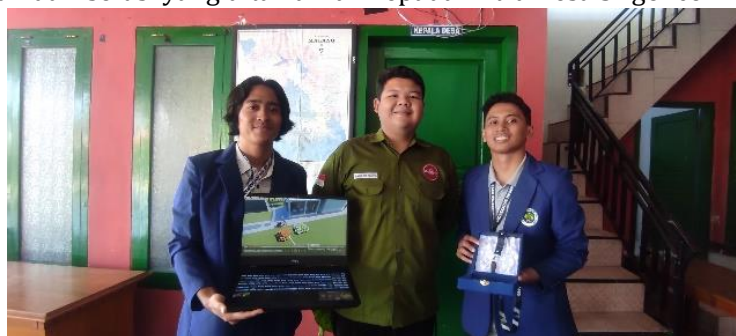
Gambar 7 Sosialisasi Desain kepada pihak Desa Srigonco

Tahap akhir adalah tahap evaluasi dan pelaporan, evaluasi dilakukan berdasarkan hasil dari pelaksanaan kegiatan pengabdian masyarakat yang telah dilaksanakan. Hasil evaluasi berupa capaian dari solusi yang ditawarkan kepada mitra Desa Srigonco.