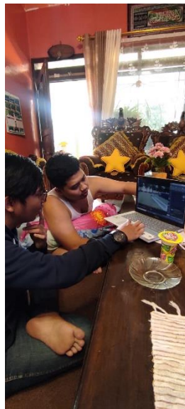
Gambar 3 Kegiatan Diskusi dengan Pihak Desa