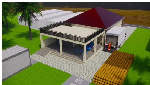
Gambar 4 Penampakan 3D Pengolahan Arang Bricket

Pembuatan desain rencana dilakukan dengan membuat gambar rencana dalam bentuk 2D dan 3D berdasarkan data hasil survei yang telah dilakukan. Pembuatan desain ini menggunakan sistem komputasi dengan memanfaatkan beberapa software seperti Sketchup dan Enscape.