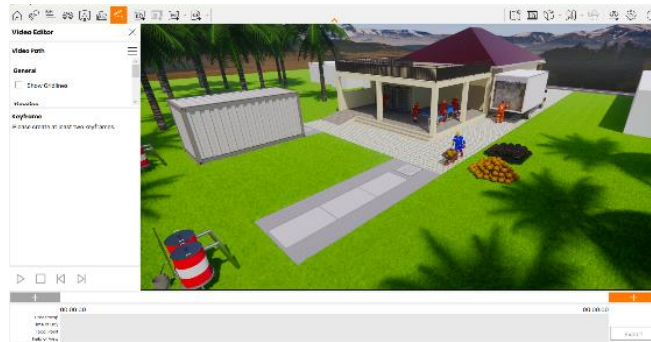
Gambar 5 Proses perenderan 3D Animasi menggunakan Enscape

Pembuatan video 3d Animasi dilakukan setelah tahap pendesainan telah selesai. Proses pembuatan video 3D Animasi dilakukan dengan menggunakan software enscape untuk merender. Kemudian setelah mendapatkan data mentah berupa video dari enscape, data tersebut selanjutnya dilakukan pengeditan menggunakan software adobe premier pro untuk memberikan kesan yang lebih informatif.