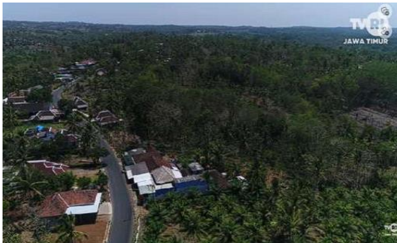
Gambar 1 Kondisi Desa Srigonco

Desa Srigonco terletak di Kecamatan Bantur Kabupaten Malang sekitar 54 km dari pusat Kota Malang. Desa Srigonco memiliki luasan wilayah sebesar 811,9 HA dengan jumlah penduduk sebanyak 5.651 orang. Memiliki tiga dusun yaitu dusun Krajan, Dusun Sigar dan Dusun Sumber Jambe. Desa Srigonco terletak dikawasan Malang Selatan atau daerah pesisir Malang dimana daerah ini merupakan wilayah yang memiliki potensi akan komoditas kelapa. Pohon kelapa merupakan tumbuhan yang memiliki manfaat tidak hanya pada buahnya tetapi juga batang, daun, tempurung, hingga akar juga dapat diolah. Namun, pemanfaatan dari pohon kelapa pada desa Srigonco sampai saat ini masih belum dimaksimalkan. Menurut Kepala Desa Srigonco, Didit Puji Leksono, saat ditanyai mengenai permasalahan apa yang ada di Desa Srigonco, beliau menyampaikan bahwa walaupun di Desa Srigonco terdapat banyak lahan yang ditanami pohon kelapa, tetapi mayoritas masyarakat masih belum mengetahui olahan apa saja yang bisa dibuat dari bahan Pohon Kelapa, khususnya limbah tempurung kelapa.