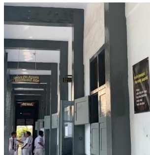
Gambar 3. Papan dan Banner Wise Word

Dalam dunia pendidikan, keberhasilan kegiatan belajar mengajar dipengaruhi oleh dua hal, yakni faktor intelektual (kecerdasan) dan non-intelektual, seperti kemampuan siswa dalam memotivasi diri. Motivasi berperan penting karena semakin tinggi motivasi baik akan memberikan hasil yang baik pula. Kebutuhan akan motivasi siswa di sekolah selalu menjadi perhatian oleh para pengajar karena mempengaruhi tingkat keberhasilan para siswa, tidak hanya di sekolah namun juga di luar sekolah. Penyampaian motivasi oleh pengajar terkadang mudah dilupakan bagi sebagian siswa. Oleh karena itu, maka dirancang sebuah kegiatan oleh mahasiswa Asistensi Mengajar di SMPN 1 Turen bernama Wise Word .