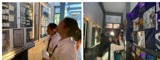
Gambar 2. Pameran Karya

Pameran karya melalui kegiatan pekan kreasi di SMPN 1 Turen diadakan pada tanggal 25 hingga 29 Oktober 2022, bertepatan dengan kegiatan bulan bahasa. Tujuan utama dari kegiatan ini dalam rangka menyalurkan bakat dan minat siswa dalam bidang akademik dan kesenian. Karya-karya yang dipamerkan merupakan hasil dari pembelajaran selama di kelas yang dituangkan dalam bentuk poster dan lukisan. Karya poster dikoordinir oleh mahasiswa dari program studi IPA dengan tema sistem perkembangbiakan pada tumbuhan dan listrik statis. Sedangkan karya lukisan dikoordinir oleh mahasiswa dari jurusan seni dan desain dengan tema ragam hias flora. Total karya yang dipamerkan pada kegiatan tersebut sebanyak 31 poster dan 42 lukisan terbaik.