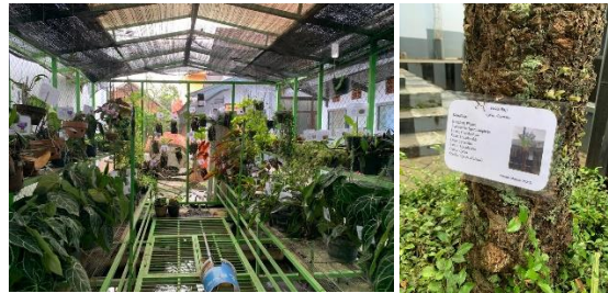
Gambar 1. Pemberian Nama Ilmiah pada Tumbuhan Greenhouse dan Lingkungan

Berdasarkan beberapa cara tersebut, yang paling memungkinkan dalam mengidentifikasi setiap jenis tumbuhan adalah cara keempat, yakni membandingkan obyek dengan gambar menggunakan aplikasi PlanNet . Aplikasi tersebut mampu mengidentifikasi jenis-jenis tumbuhan dengan cara memfoto setiap tumbuhan yang ada, maka akan ditampilkan aneka tumbuhan sejenis dengan tingkat keakuratan yang cukup baik. Selanjutnya, untuk klasifikasi setiap tumbuhan di lingkungan sekolah menggunakan sebuah situs plantamor, karena urutan taksonomi pada tumbuhan yang cukup lengkap di situs tersebut mulai dari Kingdom hingga Spesies. Setelah itu, maka dilakukan pencetakan dan laminasi untuk dipasang di beberapa spot tumbuhan. Secara keseluruhan, proses ini memakan waktu sekitar satu bulan dengan total 81 spesies tumbuhan yang ada di Greenhouse dan lingkungan sekolah.