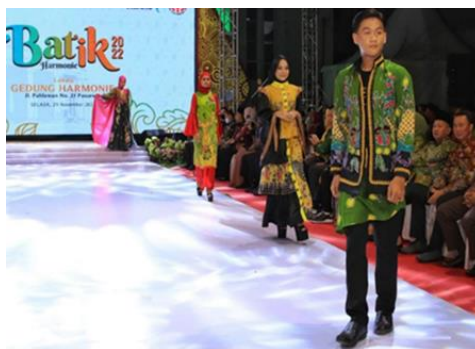
Gambar 2. Batik Harmonie Khas Kota Pasuruan

Pada konsep desain Perancangan Wisata Pasar Pertanian ini akan di desain dengan menggunakan bentuk dasar atap berupa atap dari Rumah Adat Suku Tengger dengan kombinasi struktur material baja pada atap sehingga memunculkan kesan modern tanpa menghilangkan unsur tradisional.