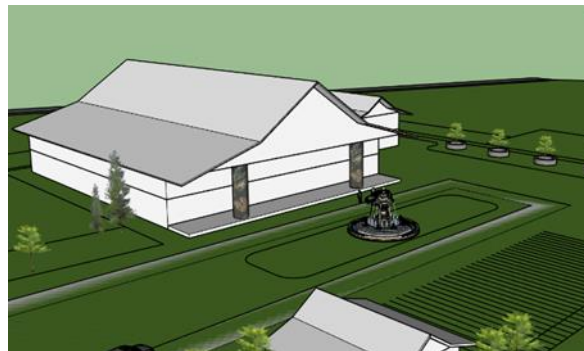
Gambar 4. Tampak Perspektif Sketsa Perancangan Wisata Pasar Pertanian

Dari gambar sketsa Perancangan Wisata Pasar Pertanian diatas, penerapan Arsitektur Neo Vernakular terletak pada penggunaan elemen fisik yaitu bentuk atau konstruksi. Bentuk atap yang merupakan unsur dari tradisional daerah dan diselesaikan dengan teknologi modern yaitu penggunaan konstruksi atap material baja, maka Perancangan Wisata pasar Pertanian memiliki bentuk atap tradisional, struktur yang modern dan memiliki dekoratif batik khas pada fasad bangunan. Sehingga terciptanya bangunan yang tidak meninggalkan atau menghilangkan unsur dari budaya setempat namun tetap modern.