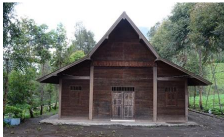
Gambar 1. Rumah Adat Suku Tengger

Menerapkan bentuk-bentuk arsitektur tradisional yang dikombinasi dengan arsitektur modern sehingga tidak menghilangkan nilai-nilai tradisi daerah setempat. Bentuk rumah tradisional yang diterapkan adalah bentuk atap dari Rumah Adat Tradisional Suku Tengger adalah salah satu suku yang tinggal di sekitar Gunung Bromo, baik yang dijangkau dari daerah Probolinggo, Lumajang dan Pasuruan.