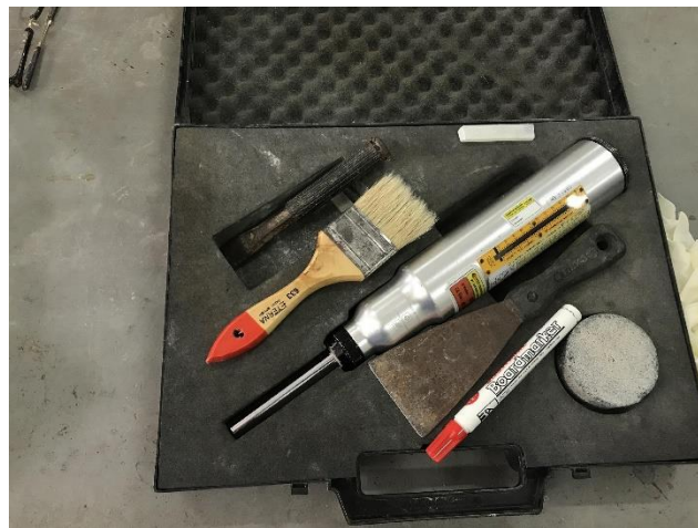
Gambar 5. Alat Hammer Test

Selain itu, kegiatan pengabdian kepada masyarakat ini juga menghasilkan beberapa luaran. Adapun luaran dari kegiatan pengabdian kepada masyarakat ini disajikan oleh Tabel 1.