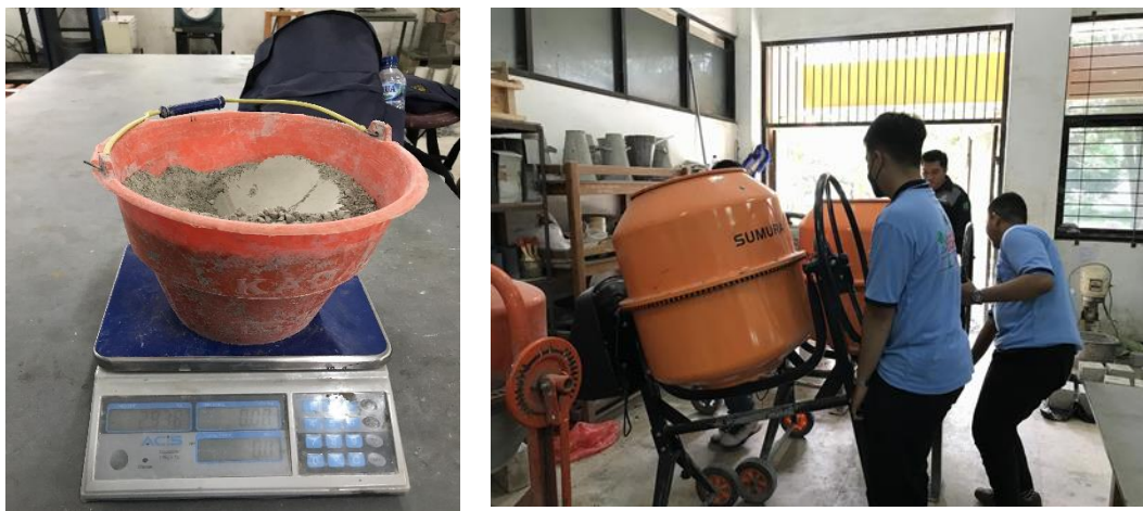
Gambar 3. Proses Pembuatan

Setelah dilakukan pelatihan mengenai proses pembuatan mix design beton, untuk emmperdalam pemahaman para peserta dilakukan pembuatan beton. Langkah awal yang dilakukan yaitu mempersiapkan seluruh alat dan bahan serta menimbang bahan-bahan tersebut seperti ditunjukkan pada Gambar 5. Tahap ini dilakukan oleh para mahasiswa KKN dibawah bimbingan para dosen.