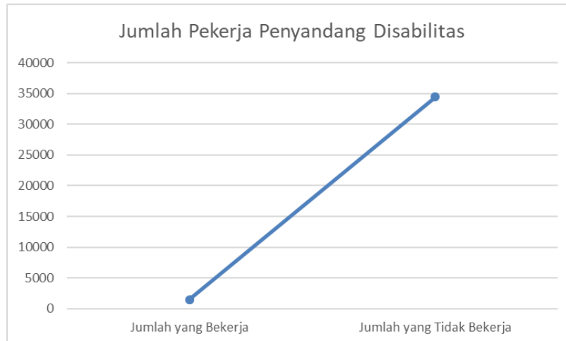
Gambar 3. Perbandingan Jumlah Pekerja dan Tidak Bekerja Penyandang Disabilitas

Dan berdasarkan data yang diperoleh dari data Jabar Juga diperoleh bahwa angka penyandang disabilitas yang tidak bekerja cukup tinggi yaitu berjumlah sebanyak 34475 jiwa sedangkan jumlah yang bekerja hanya sebanyak 1478 jiwa. Bisa dilihat pada gambar 3. Hal ini menunjukkan tingginya jumlah penyandang disabilitas yang tidak bekerja padahal beberapa dari mereka juga ingin merasakan bekerja seperti layaknya orang pada umumnya. Mereka yang seharusnya bisa dan mampu untuk bekerja tetapi tidak mendapatkan akses pekerjaan. Hal tersebut sangat disayangkan apalagi di era digital seperti saat ini.