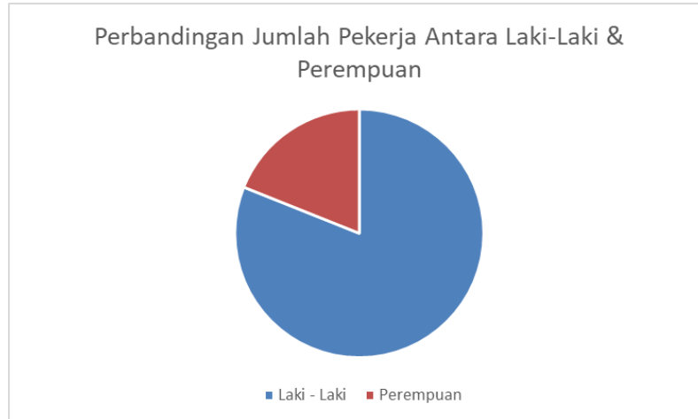
Gambar 2. Perbandingan Jumlah Pekerja Penyandang Disabilitas Antara Laki - Laki dan Perempuan

Dan berdasarkan data yang diperoleh dari data Jabar Juga diperoleh bahwa angka penyandang disabilitas yang tidak bekerja cukup tinggi yaitu berjumlah sebanyak 34475 jiwa sedangkan jumlah yang bekerja hanya sebanyak 1478 jiwa. Bisa dilihat pada gambar 3. Hal ini menunjukkan tingginya jumlah penyandang disabilitas yang tidak bekerja padahal beberapa dari mereka juga ingin merasakan bekerja seperti layaknya orang pada umumnya. Mereka yang seharusnya bisa dan mampu untuk bekerja tetapi tidak mendapatkan akses pekerjaan. Hal tersebut sangat disayangkan apalagi di era digital seperti saat ini.