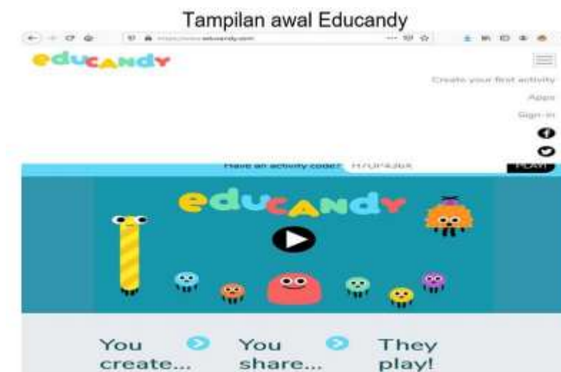
Gambar 1. Tampilan awal Educandy