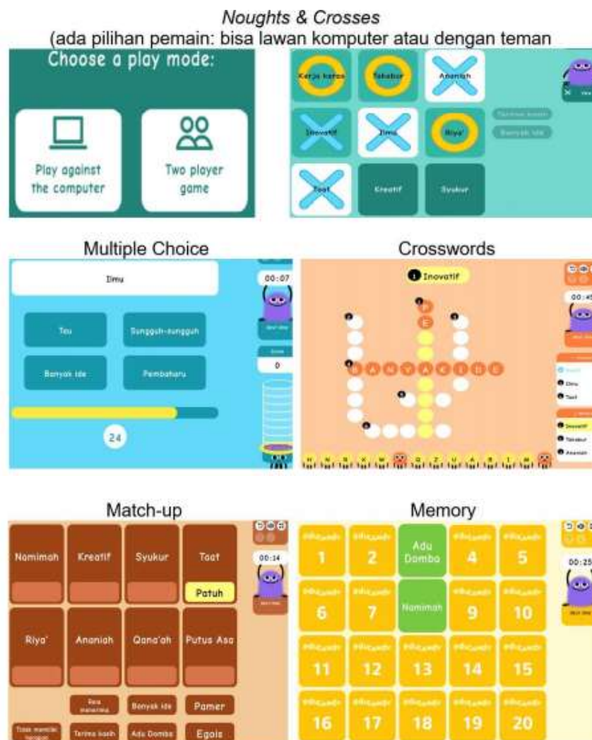
Gambar 4. Pilihan menu berbagai macam game