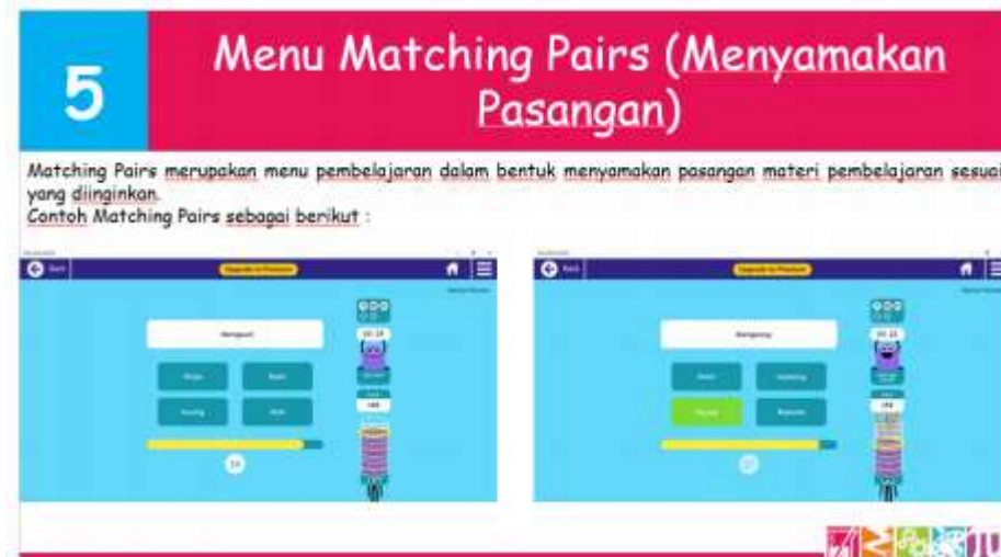
Gambar 7. Menu Matching Pairs