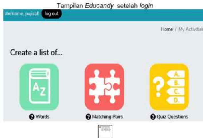
Gambar 2. Tampilan Educandy setelah login