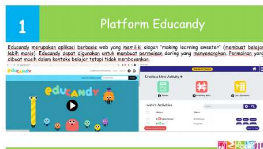
Gambar 5. Gambaran pelatihan Educandy

Berikut ini gambaran dari pelatihan yang akan dilaksanakan :