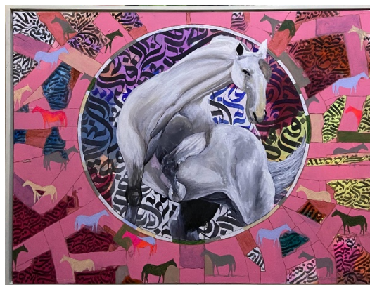
Gambar 10. Lukisan “Serpih” karya Solahuddin Achmad

Berdasarkan ketiga indikator tersebut, lukisan Serpih dapat dinilai sebagai karya yang menunjukkan perkembangan signifikan dalam perjalanan artistik Solahuddin Achmad. Karya ini tidak hanya unggul dari segi teknis dan visual, tetapi juga berhasil menyatukan pengalaman personal, kondisi psikologis, nilai spiritual, dan relasi sosial ke dalam satu kesatuan ekspresi artistik yang matang. Dengan demikian, Serpih merepresentasikan capaian estetis dan konseptual yang lebih kompleks serta menandai pendewasaan gaya dan pemikiran seni Solahuddin Achmad.