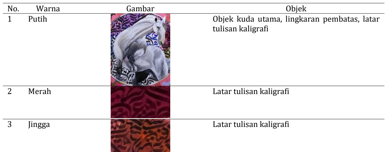
Tabel 2. Penggunaan Warna dalam Lukisan Serpih

Penggunaan warna dalam lukisan Serpih tergolong kaya dan beragam. Terdapat sebelas warna utama yang digunakan oleh seniman. Rincian penggunaan warna disajikan pada Tabel 2 berikut.