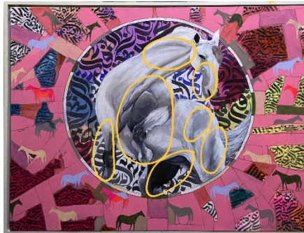
Gambar 7. Unsur Gelap Terang