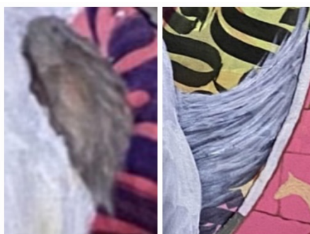
Gambar 6. Unsur Tekstur

Tekstur yang ditampilkan dalam lukisan Serpih merupakan tekstur semu. Tekstur tersebut terlihat pada penggambaran bagian ekor dan jambul kuda yang divisualisasikan menyerupai tekstur rambut, meskipun secara nyata permukaan lukisan tetap rata.