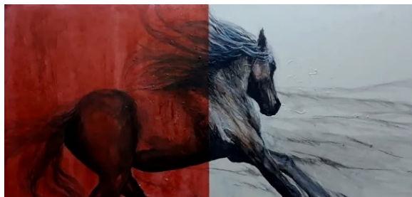
Gambar 9. Lukisan “Garis Hidup” karya Solahuddin Achmad

Adapun dari aspek kekuatan ekspresi, lukisan Serpih dinilai memiliki daya ungkap emosional yang kuat. Ekspresi kesedihan, perjuangan, dan kegelisahan tergambar melalui gestur kuda (Nikmah & Suryandari, 2025), arah pandangan mata, serta pemilihan warna yang kontras dan simbolis. Karya ini mampu membangkitkan respons emosional penghayat berupa rasa haru, empati, dan refleksi batin. Berbeda dengan Garis Hidup yang menyampaikan pesan secara lebih langsung, Serpih menghadirkan pengalaman estetis yang menuntut keterlibatan emosional dan intelektual, sehingga makna yang muncul terasa lebih dalam dan berlapis.