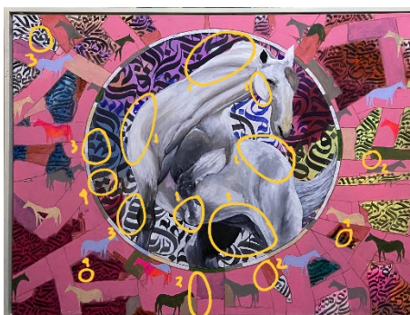
Gambar 3. Unsur Garis

Pada lukisan ini, objek kuda tidak digambarkan dengan garis linier yang tegas, melainkan menggunakan garis struktural semu sehingga menghadirkan kesan realistis. Beberapa jenis garis yang tampak antara lain: (1) garis lengkung pada anatomi tubuh kuda, (2) garis lurus vertikal dan horizontal, (3) garis bergelombang, serta (4) garis zig-zag. Keempat jenis garis tersebut tersebar pada seluruh elemen visual, baik pada objek utama maupun elemen pendukung.