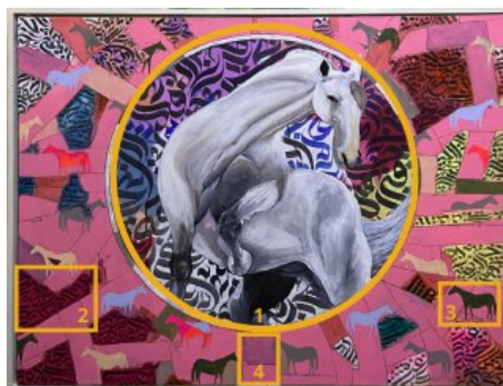
Gambar 2. Pembagian Empat Panel dan Identifikasi Tulisan

Untuk memudahkan proses deskripsi, lukisan Serpih dibagi ke dalam empat panel berdasarkan objek visual yang tampak. Pembagian panel tersebut disajikan pada Gambar 2.