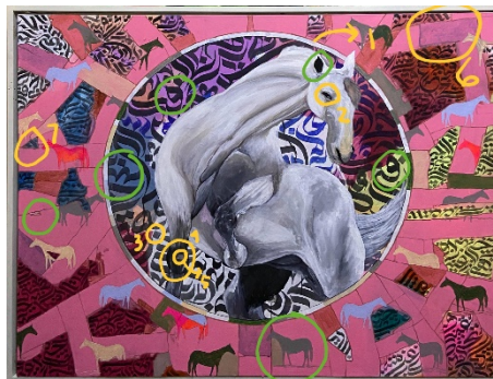
Gambar 5. Unsur Bidang

Dalam lukisan Serpih terdapat dua jenis bidang, yaitu bidang geometris dan bidang nongeometris. Bidang geometris tampak pada bentuk lingkaran yang membingkai objek kuda, mata kuda berbentuk setengah lingkaran, serta beberapa bentuk lain seperti persegi, persegi panjang, segitiga, trapesium, dan heksagon yang muncul pada detail anatomi kuda. Sementara itu, bidang nongeometris atau bidang bebas terlihat pada elemen kaligrafi abstrak dan serpihan garis yang tidak memiliki bentuk teratur.