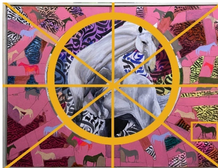
Gambar 8. Komposisi Sentral

Lukisan Serpih menggunakan komposisi sentral, dengan objek kuda sebagai pusat perhatian yang ditempatkan di tengah bidang gambar. Secara proporsional, ukuran kuda tampak lebih dominan dibandingkan elemen visual lainnya, sehingga menjadikan kuda putih sebagai point of interest utama dalam karya ini.