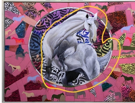
Gambar 4. Unsur Bentuk