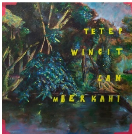
Gambar 1. Lukisan Macari Oase Tengah Kota Karya Ardiansyah Prainhantanto

warna serta detail objek menarik perhatian yang menggelitik pikiran serta perasaan untuk merespons dan mengetahui latar belakang dibalik penciptaannya.