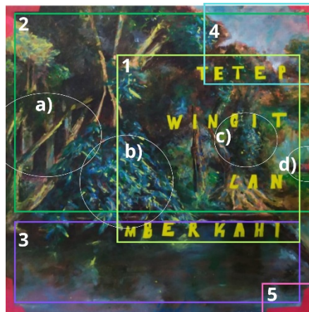
Gambar 3. Detail objek pada lukisan