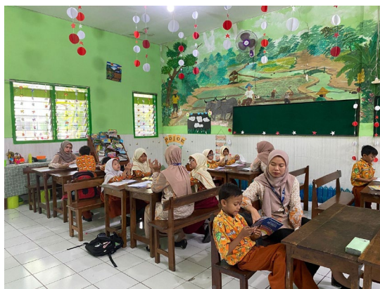
Gambar 1. Bimbingan belajar bersama mentor

Upaya yang dilakukan mengatasi kesulitan membaca yaitu melalui program Bimbingan Belajar, melalui program yang dibuat oleh peneliti dan berdasarkan hasil diskusi bersama oleh guru yaitu membuat program bimbingan belajar. Alasan peneliti membuat program bimbingan belajar yaitu agar peserta didik yang mengalami kesulitan membaca mendapatkan waktu tambahan untuk belajar membaca. Program bimbingan belajar digunakan bertujuan untuk peserta didik yang memiliki kesulitan membaca dapat memiliki kesempatan belajar membaca secara lebih intens diluar jam pelajaran. Program bimbingan ini dilakukan pada bulan Maret – April tahun 2024 setiap hari rabu pukul 13.00 -13.45. Setiap peserta didik memiliki mentor yang berbeda-beda, tetapi mentor setiap didik tidak berganti dari awal kegiatan sehingga mentor dapat mengetahui perkembangan setiap peserta didiknya dengan baik. Setiap pertemuan bimbingan belajar, peserta didik akan diberikan treatment yang berbeda. Bahan bimbingan membaca akan dipersiapkan oleh mentor sesuai dengan perkembangan yang dialami oleh peserta didik.