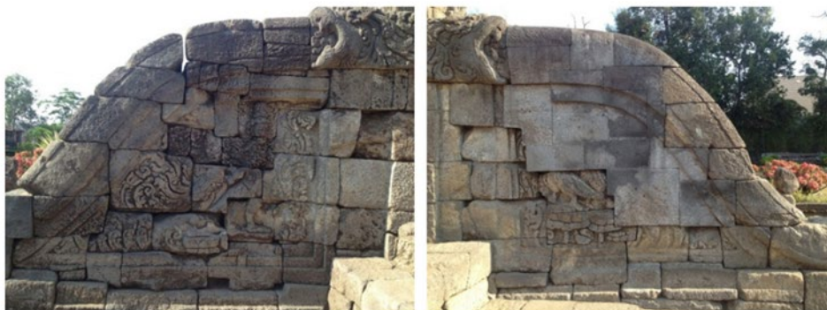
Gambar 2. Relief Kinara-Kinari pada tangga Candi Badut

Candi Badut diperkirakan salah satu candi tertua di Jawa karena terdapat ciri-ciri khusus yang menyerupai candi berlanggam Jawa Tengah yaitu masa sebelum 1000 M. Ciri-ciri tersebut adalah (1) kala tidak berahang bawah di pintu masuk; (2) hiasan Kinara dan Kinari yaitu relief berbentuk burung berkepala manusia; (3) relief bunga pada dinding candi seperti di candi Kalasan. Relief Kinara dan Kinari adalah salah satu pola hias candi Badut yang unik. Relief kinara dan kinari pada candi Badut terdapat di beberapa bagian yaitu: bagian pipi tangga, bagian badan kanan, dan bagian badan kiri candi Badut. Pada bagian pipi tangga candi Badut terdapat keunikan dari langgam candi di Jawa Tengah. Keunikan tersebut terletak pada (1) penempatan secara terpisah pada sisi kanan dan kiri tangga; (2) kinara dan kinari tidak mengapit suatu objek; (3) kinara dan kinari digambarkan secara datar dan tampak samping, yang membuatnya berbeda dari candi di Jawa Tengah (Setiawan, 2019).