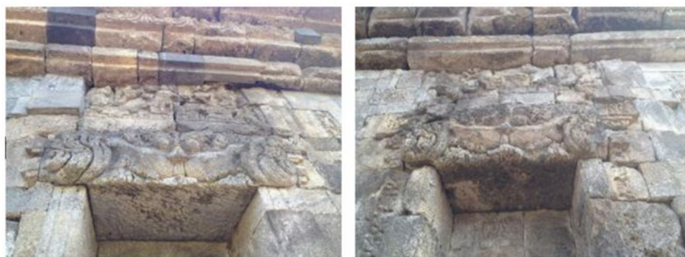
Gambar 3. Relief Kinara-Kinari pada badan Candi Badut

dimana Kinara dan Kinari mengapit objek berbentuk gapuran yang kemungkinan diartikan sebagai simbol khayangan. Walaupun terdapat perbedaan namun tujuan penggambarannya adalah sepasang mahluk penjaga khayangan (Setiawan, 2019).