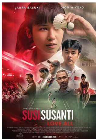
Gambar 1. Poster Film Susi Susanti: Love All

yang menyatakan bahwa film ini menampilkan nasionalisme melalui prestasi, semangat persatuan, dan kehormatan bangsa.