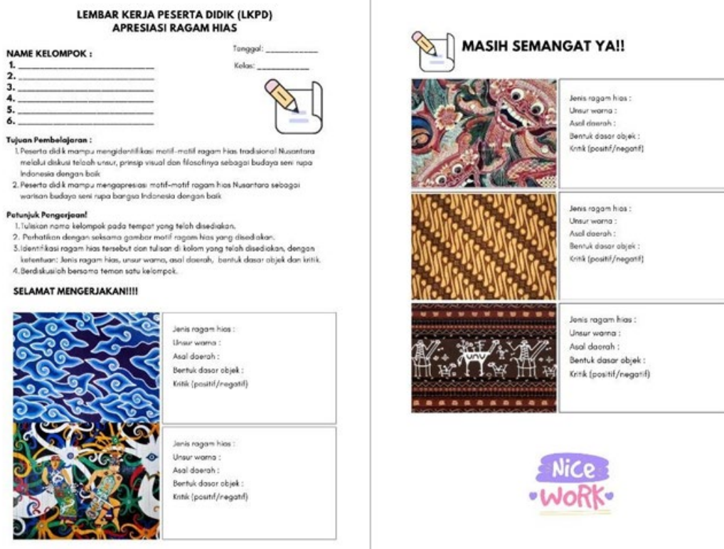
Gambar 2. Lembar kerja peserta didik (LKPD Kelompok)