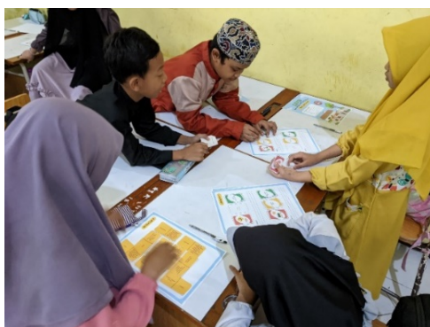
Gambar 2. Dokumentasi uji coba kelompok besar

Siswa tampak antusias dan fokus saat mendengarkan penjelasan, kemudian mulai bekerja sama dalam kelompok untuk menyelesaikan tugas-tugas yang terdapat dalam LKPD. Aktivitas ini tidak hanya mendorong siswa untuk memahami materi secara mendalam tetapi juga meningkatkan keterampilan kolaborasi mereka. Setelah pengerjaan LKPD selesai, peneliti meminta siswa untuk mengisi angket respon sebagai bagian dari pengumpulan data untuk mengukur tingkat kepraktisan produk yang diuji coba.