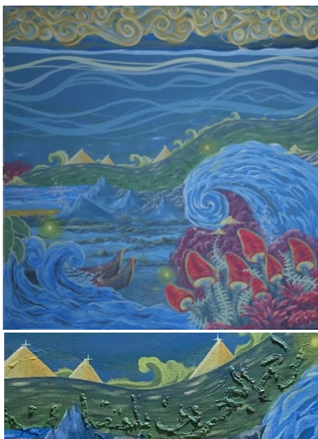
Gambar 11. Detail Lukisan 5

Pembahasan karya meliputi: nilai estetis, dan nilai simbolis, Nilai estetis pada ilustrasi ini adalah nilai intrinsik karya yang diantaranya: garis, bentuk, warna, dan komposisi. Pada karya bagian ini berkonsepkan tentang fenomena adanya api didasar laut pada lukisan ini tertulis kaligrafi “وَالْبَحْرُ الْمَسْجُورُ” yang memiliki arti “dan laut yang di dalam tanahnya ada api” peletakan kaligrafi dibentuk seperti rongga bebatuan. Dalam lukisan ini, garis horizontal cenderung melengkung, mencerminkan gerakan dinamis dari gelombang laut dan awan. Namun, yang menjadi objek utama bukanlah gunung, melainkan aliran api yang menyala di dalam lautan, yang menggambarkan makna dari ayat yang telah disebutkan. Meskipun demikian, gunung, tumbuhan, dan bebatuan berfungsi sebagai unsur pendukung yang signifikan, terutama gunung yang terletak di dasar lautan. Warna, bentuk, dan komposisi yang digunakan dalam karya ini adalah hasil dari imajinasi pelukis yang mencerminkan kondisi misterius dan fenomenal di dasar lautan. Dengan cara ini, lukisan ini tidak hanya menyajikan visual yang menarik, tetapi juga mengajak penonton untuk merenungkan kedalaman makna yang terkandung di dalamnya. Gaya yang diadopsi dalam lukisan ini adalah surealisme, yang semakin memperkaya pengalaman visual dan naratif yang ingin disampaikan.