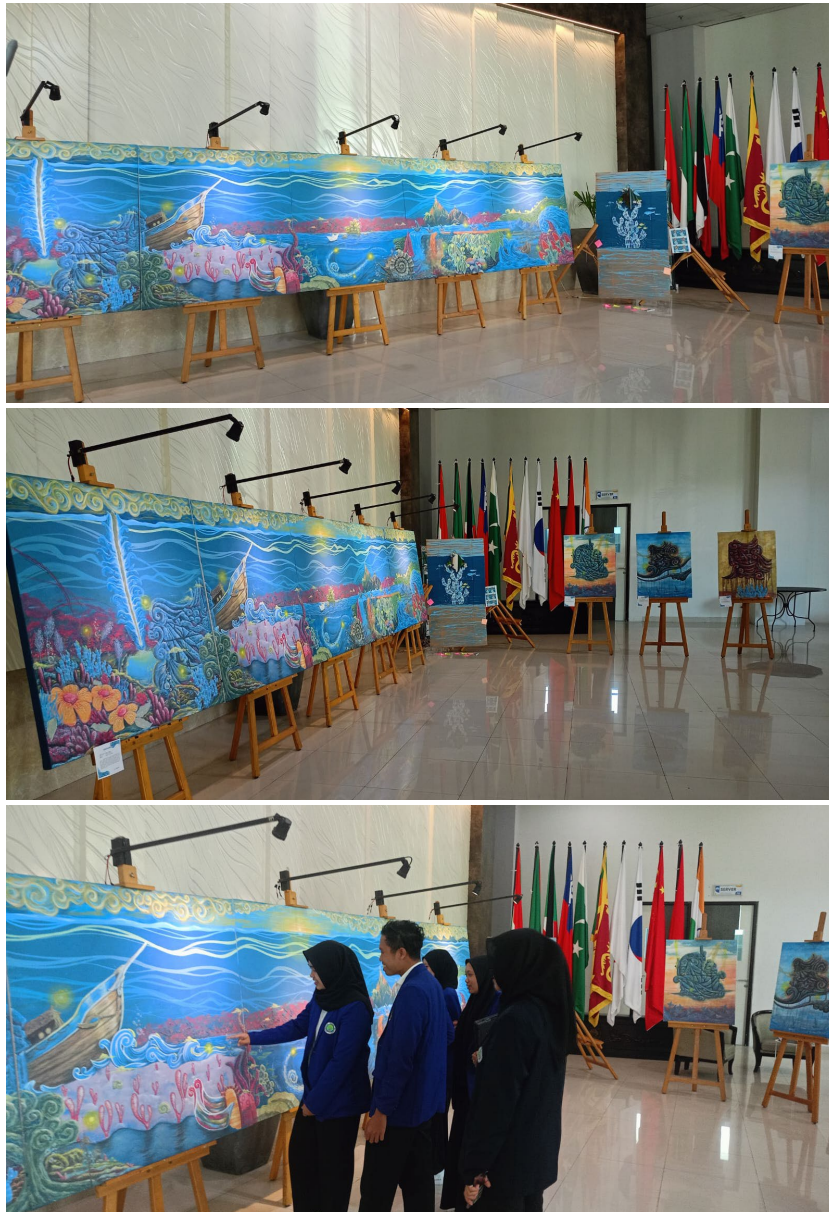
Gambar 12. Pameran Karya

Pada tahapan ini pelukis melaksanakan kegiatan pameran seni yang bertujuan untuk menampilkan karya lukis yang telah diciptakan. Pameran karya merupakan tahapan terakhir dalam proses penciptaan karya seni, yang berfungsi sebagai sarana apresiasi sekaligus media komunikasi antara seniman dan masyarakat.