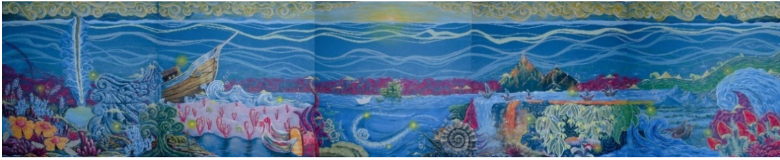
Gambar 6. Hasil Lukisan

Karya lukis ini berjudul "Segara Segoro", penciptaan menggunakan media cat akrilik di atas kanvas. Ukuran karya ini adalah 120 cm x 120 cm yang berjumlah 5 karya di kerjakan pada tahun 2024. Objek utama pada karya ini adalah kaligrafi, lautan atas dan lautan bawah, pada laut atas menggambarkan eksotik luasnya lautan sedangkan pada laut bawah banyak menggambarkan tentang fenomena dan keragaman pada lautan. Warna pada karya condong berwarnakah biru tua yang memberikan kesan kedalaman laut, pencahayaan difokuskan pada bagian Tengah atas karya. Bentuk keseluruhan lebih condong menggambarkan dilaut bawah yang memiliki berbagai unsur fenomena alam dan imajinasi di dalamnya. Aliran Lukis yang digunakan lebih condong terhadap aliran surealisme yang mengabungkan antara dunia nyata, Fenomena dan imajinasi pelukis dalam proses visualisasi karya dibutuhkan pengalaman serta kepekaan artistik senimannya dikaitkan dengan sumber ide yang telah ditetapkan. Pengalaman artistik berkaitan dengan kemampuan teknis dalam mengolah material sebagai sarana mewujudkan gagasan ke dalam bentuk karya. Kepekaan artistik berkaitan dengan kemampuan imajinasi seniman dalam menangkap fenomena untuk diwujudkan menjadi suatu karya seni (Ponimin & Guntur, 2021).