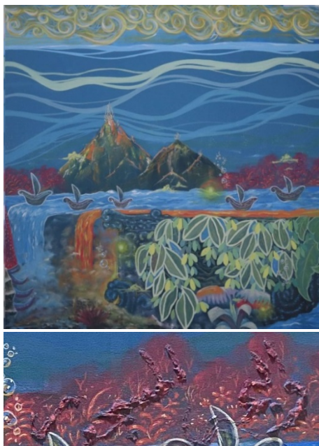
Gambar 10. Detail Lukisan 4

Pembahasan karya meliputi: nilai estetis, dan nilai simbolis, Nilai estetis pada ilustrasi ini adalah nilai intrinsik karya yang diantaranya: garis, bentuk, warna, dan komposisi. Pada karya bagian ini berkonsepkan tentang keindahan ciptaan Allah SWT pada lukisan ini tertulis kaligrafi “اللَّهُ الَّذِي خَلَقَ السَّمَوَاتِ وَالْأَرْضَ وَمَا بَيْنَهُمَا” yang memiliki arti “Allah-lah yang menciptakan langit dan bumi dan apa diantara keduanya” Peletakan kaligrafi dalam lukisan ini dirancang menyerupai rongga bebatuan. Garis horizontal dalam karya ini tampak melengkung, mencerminkan gerakan gelombang laut dan awan. Yang menarik, di bagian tengah terdapat batu atau pulau yang dibentuk menyerupai lafaz Allah. Di bawah laut, terlihat sebuah kapal yang terbuat dari kertas, menggambarkan kerentanan manusia yang dapat tenggelam kapan saja. Di bagian bawah lukisan, gelombang bersinar menyertai beragam bentuk pertumbuhan, yang mencerminkan imajinasi pelukis mengenai misteri laut. Gaya aliran yang diterapkan dalam lukisan ini adalah surealisme, yang semakin memperdalam makna dan nuansa visualnya.