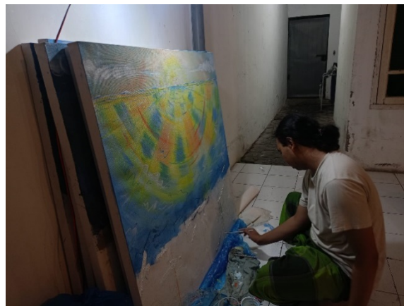
Gambar 5. Proses Melukis