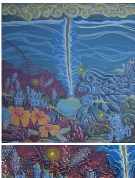
Gambar 7. Detail Lukisan 1

Visualisasi karya, sebelum membahas lebih dalam karya ini juga dapat dinikmati secara terpisah, artinya setiap pisahan pada karya ini memiliki kandungan makna dan visualisasi karya yang dapat dinikmati.