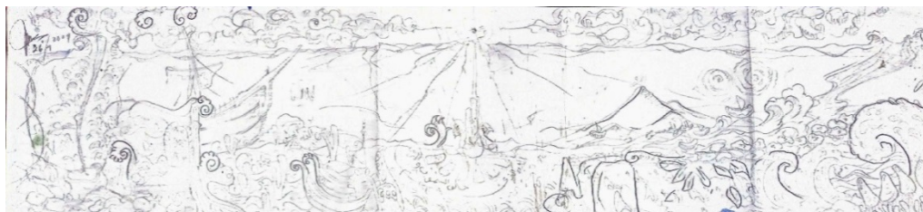
Gambar 2. Sketsa Terpilih

Sketsa terpilih dengan tema eksotik laut menggambarkan keindahan dan keragaman kehidupan bawah laut melalui komposisi yang cermat dan dinamis. Di tengah sketsa, sebuah terumbu karang yang kaya warna menjadi pusat perhatian, dikelilingi oleh berbagai unsur, menciptakan kontras yang mencolok dengan latar belakang laut yang dalam dan misterius. Garis-garis melengkung yang halus dan bentuk organik dalam sketsa ini mengalir secara harmonis, meniru bentuk-bentuk alami di lautan, seperti gelombang dan bentuk karang. Memberikan kesan kedalaman dan dimensi, sementara elemen dekoratif menambahkan detail yang memikat. Komposisi ini tidak hanya menangkap keindahan visual dari dunia laut, tetapi juga mengundang pengamat untuk merasakan kedamaian dan keajaiban yang tersembunyi di bawah permukaan laut. Berikut sketsa terpilih kaligrafi kontemporer eksotik lautan pada ayat Al-Quran.