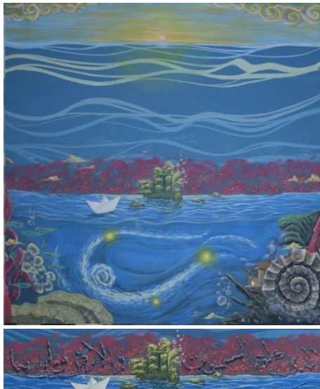
Gambar 9. Detail Lukisan 3

Pembahasan karya meliputi: nilai estetis, dan nilai simbolis, Nilai estetis pada ilustrasi ini adalah nilai intrinsik karya yang diantaranya: garis, bentuk, warna, dan komposisi. Pada karya bagian ini berkonsepkan tentang keindahan ciptaan Allah SWT pada lukisan ini tertulis kaligrafi “اللَّهُ الَّذِي خَلَقَ السَّمَوَاتِ وَالْأَرْضَ وَمَا بَيْنَهُمَا” yang memiliki arti “Allah-lah yang menciptakan langit dan bumi dan apa diantara keduanya” Peletakan kaligrafi dalam lukisan ini dirancang menyerupai rongga bebatuan. Garis horizontal dalam karya ini tampak melengkung, mencerminkan gerakan gelombang laut dan awan. Yang menarik, di bagian tengah terdapat batu atau pulau yang dibentuk menyerupai lafaz Allah. Di bawah laut, terlihat sebuah kapal yang terbuat dari kertas, menggambarkan kerentanan manusia yang dapat tenggelam kapan saja. Di bagian bawah lukisan, gelombang bersinar menyertai beragam bentuk pertumbuhan, yang mencerminkan imajinasi pelukis mengenai misteri laut. Gaya aliran yang diterapkan dalam lukisan ini adalah surealisme, yang semakin memperdalam makna dan nuansa visualnya.