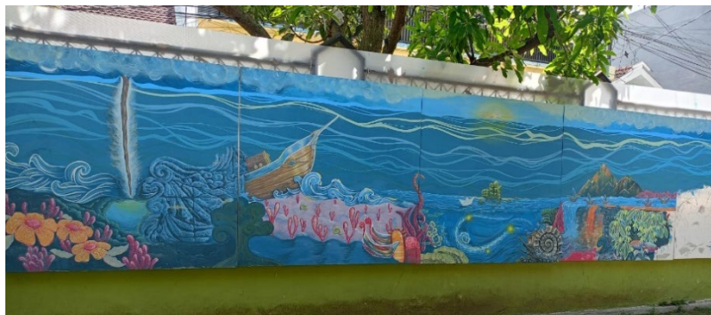
Gambar 4. Tahapan Melukis

Setelah tahap sketsa, proses dilanjutkan ke tahap melukis di atas kanvas. Tahap ini merupakan inti dari keseluruhan proses penciptaan karya, di mana pelukis mulai mengolah visual dengan menyesuaikan kembali proporsi yang telah dibuat pada sketsa serta menerapkan berbagai teknik melukis sesuai kebutuhan karya.