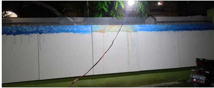
Gambar 3. Pembuatan Sketsa

Setelah tahap sketsa, proses dilanjutkan ke tahap melukis di atas kanvas. Tahap ini merupakan inti dari keseluruhan proses penciptaan karya, di mana pelukis mulai mengolah visual dengan menyesuaikan kembali proporsi yang telah dibuat pada sketsa serta menerapkan berbagai teknik melukis sesuai kebutuhan karya.