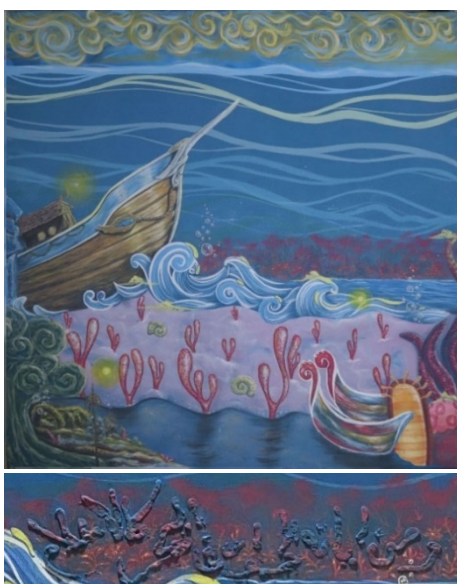
Gambar 8. Detail Lukisan 2

Pembahasan karya meliputi: nilai estetis, dan nilai simbolis, Nilai estetis pada ilustrasi ini adalah nilai intrinsik karya yang diantaranya terdapat garis, bentuk, warna, dan komposisi. Pada karya bagian ini menggambarkan konsep tentang fenomena Nabi Musa a.s. membelah lautan dengan tongkat pada lukisan ini tertulis kaligrafi tentang kejadian Nabi Musa dalam ayat Al-Quran “فَأَضْرَبْ لَهُمْ طَرِيقًا فِي الْبَحْرِ” yang artinya dan pukullah (buatlah) untuk mereka jalan dilaut” peletakan kaligrafi dibentuk seperti rongga bebatuan. Aspek garis horizontal pada lukisan ini condong melengkung karena terpacu pada gelombang laut dan awan, sedangkan aspek garis vertikal pada lukisan ini menggambarkan objek utama yaitu sebuah tongkat yang menusuk sampai dasar lautan. Unsur bentuk yang ada condong memperlihatkan keadaan laut yang berwarna condong gelap tapi tidak menyeramkan, ada bebatuan yang mempresentasikan sebuah prasasti berbentuk kapal ada pula bunga serta tumbuhan yang terbangun dari imajinasi saya bahwa lautan masih memiliki misteri, aliran yang digunakan dalam lukisan yaitu surealisme.