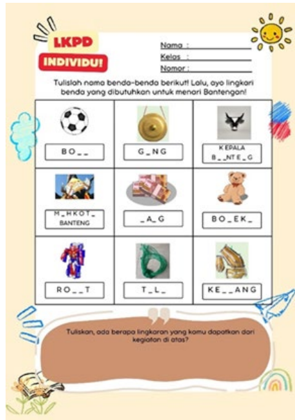
Gambar 2. LKPD untuk tingkat kemampuan sedang berkembang

LKPD tersebut telah digunakan dalam pembelajaran Bahasa Indonesia dengan tujuan pembelajaran yaitu peserta didik diharapkan mampu menentukan kata-kata sederhana dengan tepat dan mampu mengklasifikasikan perbedaan kebutuhan dan keinginan berdasarkan kata-kata sederhana tersebut. Lembar kerja tersebut diberikan kepada peserta didik berdasarkan tingkat kemampuan dasar baca, tulis dan hitung yang telah diinformasikan pada kegiatan wawancara sebelumnya. Adapun hasil dari pengerjaan lembar kerja tersebut secara keseluruhan dapat dilihat pada diagram berikut: