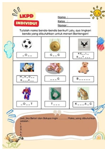
Gambar 1. LKPD untuk tingkat kemampuan mahir

Berdasarkan hasil wawancara tersebut, peneliti dapat menyesuaikan asesmen formatif yang akan dibuat yaitu berupa lembar kerja yang diharapkan dapat mengakomodasi tahapan perkembangan serta tingkat kemampuan dari peserta didik di kelas 1 pada mata pelajaran Bahasa Indonesia. Adapun lembar kerja peserta didik yang telah digunakan sebagai berikut: