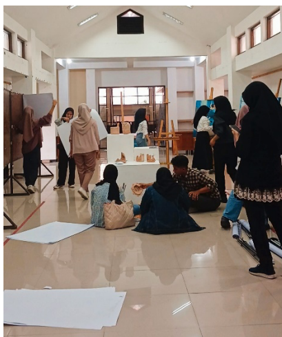
Gambar 1. Persiapan display pameran

Persiapan pameran melibatkan berbagai aspek, seperti penyusunan display karya, deskripsi karya, pembuatan barcode e-katalog, buku tamu, serta lembar kritik dan saran. Dalam proses ini, penulis dibantu oleh teman-teman agar mendapatkan hasil yang optimal. Karya dipamerkan menggunakan easel atau stand lukis dengan susunan melengkung. Pemilihan susunan ini bertujuan agar audiens seakan-akan dipeluk oleh karya, sehingga mereka lebih terhubung secara emosional dengan lukisan-lukisan bertema homesickness .