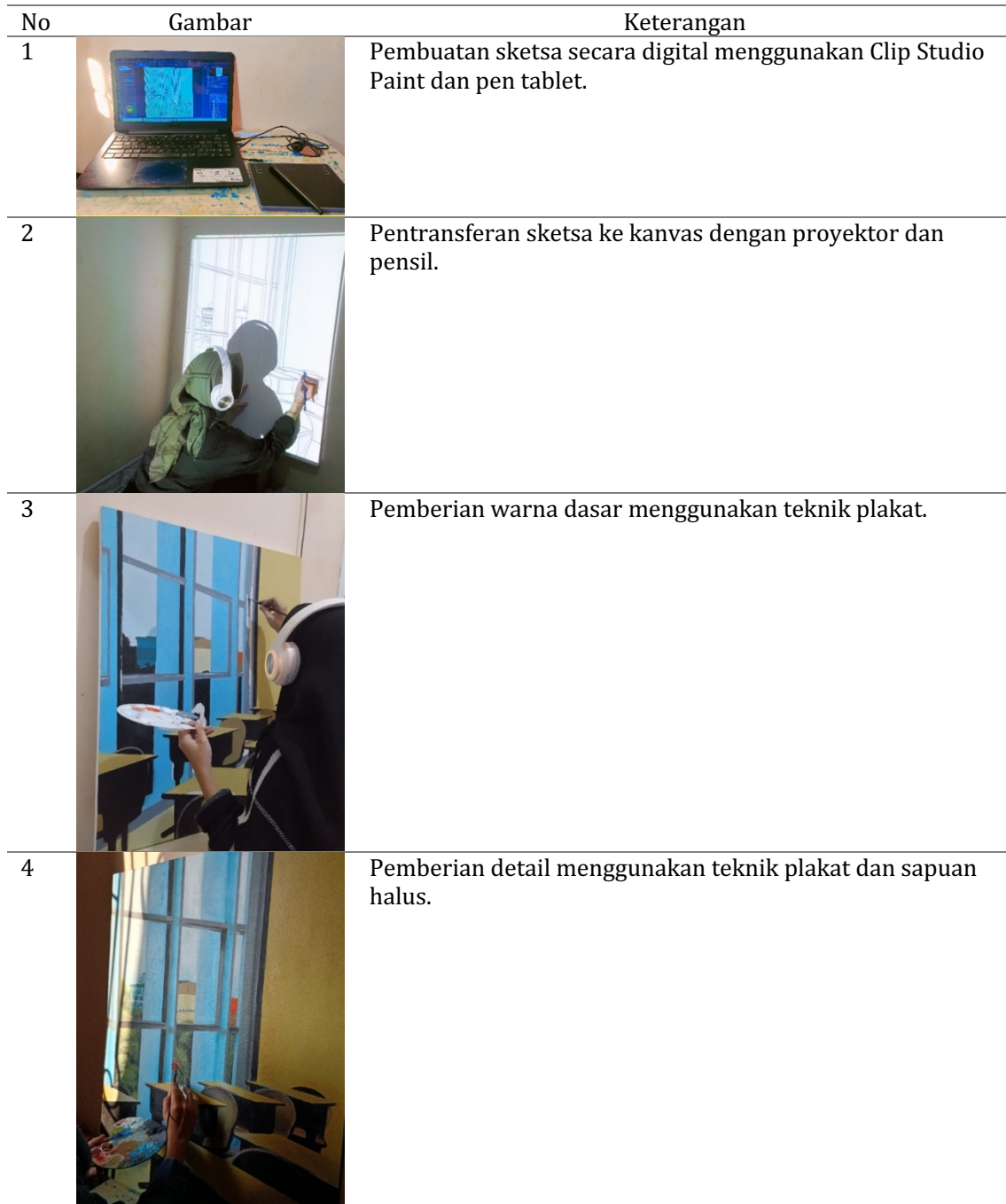
Tabel 1. Proses berkarya

Pada tahap ini, sketsa digital dipindahkan ke kanvas menggunakan proyektor. Teknik lukis yang digunakan adalah teknik plakat dengan sapuan kuas halus untuk menciptakan efek realistis.