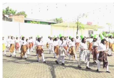
Gambar 9. Pementasan Tari Lingsir Siswi SMPN 1 Beji Program P5

Dalam proses pelestarian sebagaimana dijelaskan sebelumnya, terdapat faktor-faktor yang memengaruhi jalannya kegiatan, yakni faktor pendukung dan faktor penghambat. Faktor pendukung adalah segala hal yang membantu terciptanya Pertunjukan Laro Bocah atau mendukung pelaksanaan upaya pelestarian, sedangkan faktor penghambat merupakan kendala yang menghambat proses tersebut.