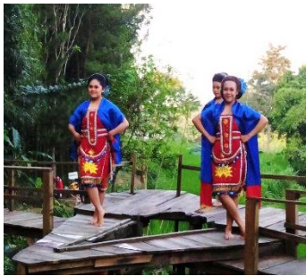
Gambar 1. Baju Tari Kendayaan pada Pertunjukan Terbang Laro

untuk kepentingan panggung promosi daerah, unsur-unsur asli Tari Kendayaan tetap dipertahankan. Beberapa elemen yang masih digunakan antara lain kemben, rapek depan-belakang, celana, sampur, dan sanggul. Hal ini dapat dilihat pada Gambar 1 dan 2 berikut.