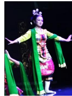
Gambar 2. Baju Tari Kendayaan pada Pertunjukan Laro Bocah

Sementara itu, busana pada Tari Lingsir menggambarkan perawakan orang Arab yang identik dengan brewok dan hidung mancung, serta mengenakan topi tinggi yang menyerupai penutup kepala bangsa Arab. Pemertahanan busana Tari Lingsir pada pertunjukan Laro Bocah tetap sesuai dengan bentuk aslinya. Penari laki-laki mengenakan baju, jubah putih, celana, selendang, sabuk, rapek, kaos kaki, sewek, gelang tangan, kain putih, topi tinggi (mirip fez), hidung-hidungan, dan kumis tebal yang mempertegas karakteristik masyarakat Timur Tengah. Penggunaan jubah putih pada penari laki-laki juga berfungsi sebagai properti, karena terdapat gerakan yang memanfaatkan kibasan jubah ke arah belakang.