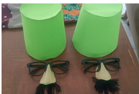
Gambar 8. Hasil Kreativitas Siswa-Siswi SMPN 1 Beji Program P5 Membuat Properti Tari Lingsir

Dengan demikian, upaya pemertahanan Pertunjukan Terbang Laro melalui wujud Laro Bocah tidak hanya sebatas partisipasi, tetapi juga memberikan pemahaman mendalam kepada peserta didik mengenai sejarah, keunikan, teknik, serta makna setiap elemennya. Hal ini menumbuhkan rasa kepemilikan terhadap kesenian daerah sebagai identitas budaya. Selain itu, nilai-nilai yang terkandung dalam pertunjukan Laro Bocah dapat diimplementasikan dalam kehidupan sehari-hari, seperti sikap religius, kepedulian sosial, serta kecintaan terhadap kesenian tradisional.