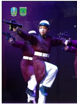
Gambar 5. Baju Tari Polisi Seri pada Pertunjukan Laro Bocah

Berdasarkan uraian di atas pemertahanan tata busana pada Pertunjukan Laro Bocah berkiblat pada tata busana di Pertunjukan Terbang Laro walaupun sudah mengalami proses modifikasi. Karakter tokoh dikuatkan kembali dengan sajian baru tanpa harus mengubah karakter yang dibawakan. Pengembangan unsur-unsur estetika disesuaikan dengan kebutuhan panggung serta perkembangan busana saat ini guna menarik perhatian penonton agar tidak terkesan kuno.