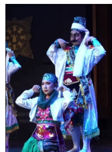
Gambar 4. Baju Tari Lingsir

Sementara itu pada penari Polisi Seri menggunakan pakaian seperti polisi yang sudah dimodifikasi serta membawa properti laras panjang seperti pada Gambar 5.