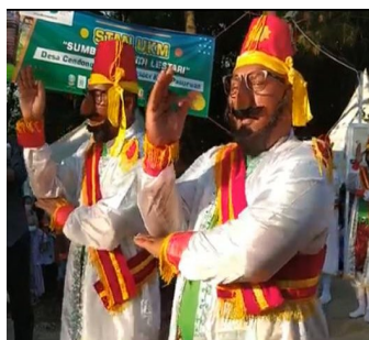
Gambar 3. Baju Tari Lingsir

Adapun busana penari perempuan sudah mengalami modifikasi, namun tetap mempertahankan unsur aslinya, seperti penggunaan ikat kepala, baju, rompi putih, kace, sabuk, rapek depan, rapek belakang, rapek samping, serta rok dalam dan luar. Pemilihan warna putih pada kostum memberikan kesan suci, karena tarian ini mengandung makna pengagungan kepada Tuhan. Hal ini sejalan dengan pendapat Opsantini (2014), yang menyatakan bahwa pemilihan warna putih pada Hirqa dalam Tari Sufi melambangkan kain kafan, yang berfungsi untuk mengingatkan manusia bahwa pada akhirnya akan kembali kepada Tuhan. Gambaran tersebut tampak pada Gambar 3 dan 4 berikut.