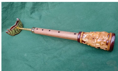
Gambar 8. Alat Musik Slompret

Drum merupakan kelompok alat musik perkusi yang terdiri atas membran yang direntangkan dan dibunyikan dengan cara dipukul menggunakan stick drum . Drum terdiri dari beberapa bagian, yaitu snare drum , tom-tom , cymbal , bass drum , dan hi-hat , yang secara keseluruhan disebut sebagai drum set . Dalam musik iringan tari Bantengan, drum berperan sebagai pengatur tempo, penegas dinamika komposisi musik, serta penanda ( clue ) transisi menuju bagian solah.