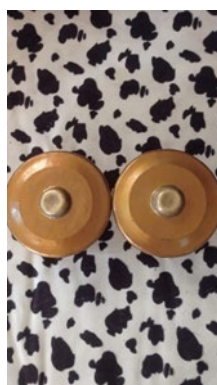
Gambar 7. Alat Musik Kenong

Instrumen musik yang digunakan dalam atraksi solah meliputi didgeridoo, kenong, slompret, gitar bass, gongseng, dan drum. Masing-masing instrumen memiliki fungsi dan peran tersendiri dalam membangun struktur musikal pada bagian B. Berikut ini merupakan deskripsi alat musik yang digunakan dalam bagian solah.