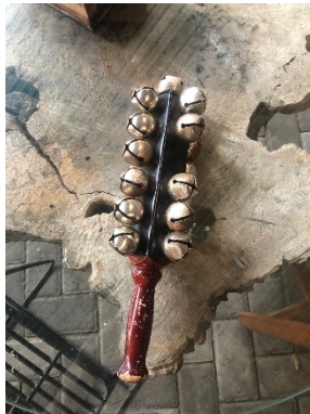
Gambar 1. Alat Musik Gongseng

Gongseng merupakan properti tari yang berfungsi sebagai penegas ritme gerak penari serta memperkuat kesan heroik dalam suasana pertunjukan. Hapidrum adalah instrumen perkusi berbahan baja yang dimainkan dengan dua stik dan berperan sebagai pengatur tempo, menyerupai fungsi metronome . Shakuhachi merupakan seruling bambu khas Jepang dengan lima lubang nada yang berfungsi sebagai pembawa melodi dari awal intro hingga outro pada bagian A. Sementara itu, didgeridoo berperan sebagai penguat suasana melalui bunyi rendah dan berkesan magis.