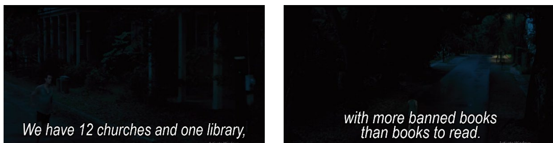
Gambar 2. Naratologi yang menunjukkan Gatlin adalah kota dengan penduduk yang sangat religious (00:01:58 – 00:02:03)

Karakteristik warga Gatlin sebagai the one dapat dilihat pada gambar berikut: