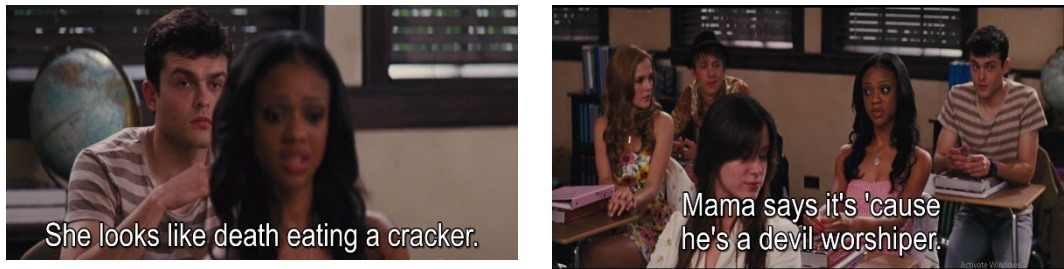
Gambar 4. Siswa Gatlin memberikan komentar kebencian pada Lena Duchanes (00:06:52 – 00:07:33)

Kebencian terhadap keluarga Ravenwood dideskripsikan sepanjang alur film. Hal ini dikarenakan mereka dianggap sebagai penyihir dan pemuja setan. Warga Gatlin sangat taat pada agama menyebabkan keluarga Ravenwood mengalami penolakan dan diskriminasi. Totalitas Manusia Gatlin muncul karena mereka adalah orang yang sangat religius, mereka menolak keberadaan yang tidak sesuai dengan standar atau system nilai mereka.