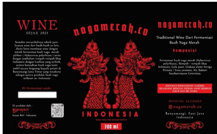
Gambar 2. Label Stiker Red Wine Nagamerah.Co Indonesia.

dominan yang digunakan adalah hitam sebagai latar belakang, merah sebagai warna objek naga, dan putih sebagai warna informasi tulisan. Warna-warna ini memiliki makna simbolik: hitam menggambarkan duka dan kehampaan akibat rendahnya harga buah naga, merah melambangkan keberanian dan semangat membangun, sedangkan putih melambangkan kemurnian dan niat baik dari pengembangan produk ini (Feisner, 2006).