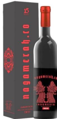
Gambar 1. Foto Produk Red Wine Nagamerah.Co Indonesia.

Pertama, indikator saliency atau keunikan dapat dilihat dari pendekatan visual yang tidak umum dalam desain wine pada umumnya. Label dari Nagamerah.Co Indonesia menampilkan sosok mitologi Jawa, yakni Sang Hyang Antaboga—naga penjaga dunia bawah tanah dalam kepercayaan Hindu-Buddha di Jawa (Lirra Media, 2020). Visual naga ini divisualkan dengan teknik hatching berwarna merah solid, ditambah dengan ornamen mahkota sebagai simbol kepemimpinan dan kehormatan. Pemilihan simbol ini merepresentasikan akulturasi budaya antara Timur (lokal) dan Barat (produk wine yang berasal dari tradisi Eropa), sekaligus menyiratkan nilai lokal dari bahan dasar produk, yakni buah naga merah ( red dragon fruit ).