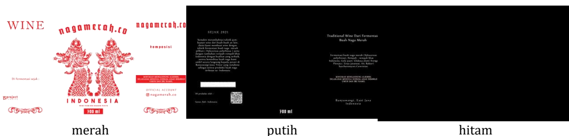
Gambar 4. Label Red Wine Nagamerah.Co Indonesia

Adapun prinsip seni yang dianalisis berdasarkan Sadjiman E.S. (2009), meliputi: kesatuan antara elemen gambar, warna, dan teks; keseimbangan simetris antara sisi kiri dan kanan desain; irama yang dibentuk oleh pengulangan ornamen; penekanan pada visual naga sebagai fokus utama; proporsi hiperbolik pada ilustrasi naga; dan kejelasan informasi melalui penempatan teks yang jelas dan informatif.