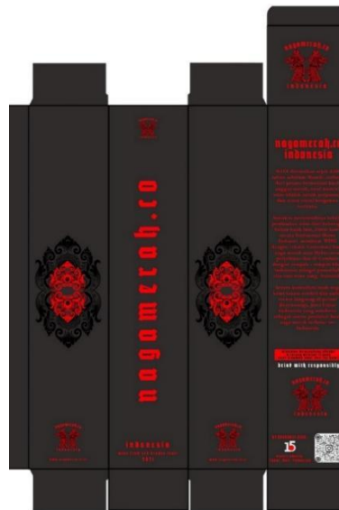
Gambar 5. Box/Kardus Red Wine Nagamerah.Co Indonesia