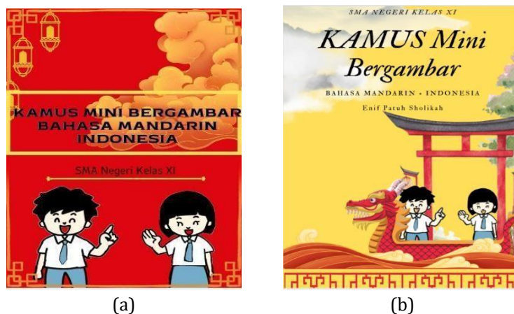
Gambar 1. Sampul kamus yang tidak dipilih (a) dan dipilih dosen pembimbing (b)

Tahap kedua adalah Design (perancangan). Pada tahap ini, peneliti membuat rancangan untuk produk media kamus mini bergambar bahasa Mandarin. Peneliti membuat rancangan pembuatan media yang disesuaikan dengan kebutuhan siswa. Peneliti memilih untuk mengembangkan media kamus mini bergambar sebagai media yang dinilai cocok dalam meningkatkan pembelajaran kosakata bahasa Mandarin siswa. Pemilihan format materi pada media kamus mini bergambar yang peneliti kembangkan menggunakan kosakata setara HSK 1 dengan total 150 kata. Kosakata HSK 1 kemudian dipilih sesuai dengan silabus bahasa Mandarin dengan tema kelas XI pembelajaran bahasa Mandarin yaitu “Kehidupan Keluarga”. Di dalam kamus terdapat kosakata, contoh kalimat, dan gambar yang disesuaikan agar menarik untuk pembelajaran. Dalam kamus bergambar ini, kosakata HSK 1 yang telah dipilih dikelompokkan berdasarkan kelas kata. Pada tahap selanjutnya kosakata disusun secara alfabetis agar mempermudah siswa dalam memahami jenis kosakata serta penggunaannya.