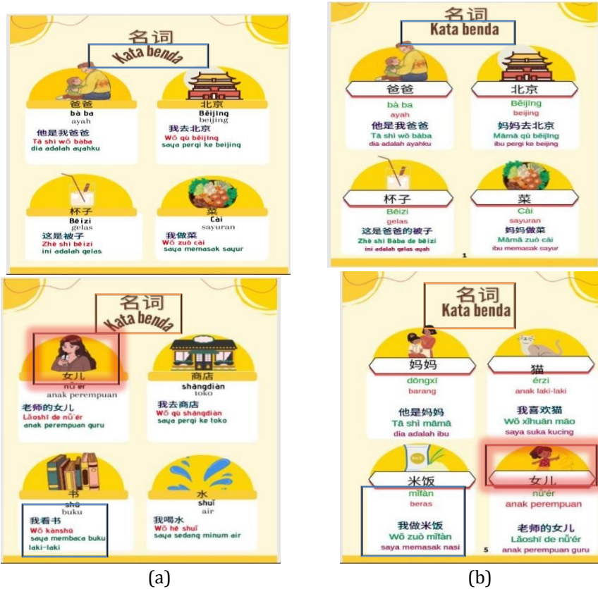
Gambar 3. Isi kamus sebelum (a) dan sesudah (b) revisi

Gambar 2 memperlihatkan font pada judul cover memiliki tingkat keterbacaan yang kurang, sehingga perlu mengganti dengan font yang lebih tebal dan memiliki keterbacaan yang lebih jelas. Gambar murid pada sampul memilih jenis gambar yang tidak sesuai dengan jenis gambar lain pada cover kamus. Nama pengembang diletakkan di kiri bawah kamus. Gambar 3 terlihat bahwa font judul sub bab (sub bagian) pada isi kamus kurang memiliki keterbacaan yang baik dan bentuk penulisan pada isi kamus memiliki bentuk yang kurang sesuai. Table hanzi harus memiliki warna yang berbeda sehingga hanzi memiliki keterbacaan yang baik. Susunan pada kalimat direvisi menggunakan susunan rata tengah agar lebih rapi. Revisi pada gambar agar lebih konsisten pada jenis gambarnya (pada gambar kata 女儿 anak perempuan).