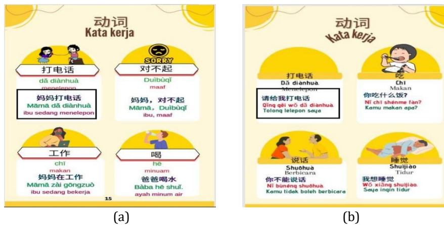
Gambar 4. Isi kamus sebelum (a) dan sesudah (b) revisi

Pada tahap validasi materi, peneliti menggunakan angket sebagai instrumen untuk membantu peneliti dalam proses merevisi produk. Data dari hasil validasi ahli materi melalui angket mencakup dua aspek yaitu aspek materi yang terdapat dalam isi kamus dan aspek bahasa. Penilaian isi kamus yaitu kesesuaian materi, kesesuaian gambar dengan kosakata, dan kesesuaian makna materi. Pada aspek bahasa, yang dinilai adalah apakah bahasa yang digunakan komunikatif dan apakah terjemahan ke bahasa Indonesia sudah sesuai. Merujuk pada indikator kesesuaian pada materi kamus mini bergambar, kosakata yang dipilih pada kamus mini bergambar sesuai dengan kosakata setara HSK 1. Kosakata juga sesuai dengan tema yaitu “Kehidupan Keluarga”. Gambar sesuai dengan kosakata, kebenaran materi pada pengelompokan kosakata, dan artinya benar. Kosakata, arti kosakata, penulisan Hànzi , dan pinyin benar, tetapi mendapatkan saran perbaikan karena ada beberapa kosakata yang masih kurang tepat. Ahli materi memberikan saran dan perbaikan pada beberapa contoh kalimat agar lebih sesuai untuk SMA kelas XI dengan tema “Kehidupan Keluarga”.