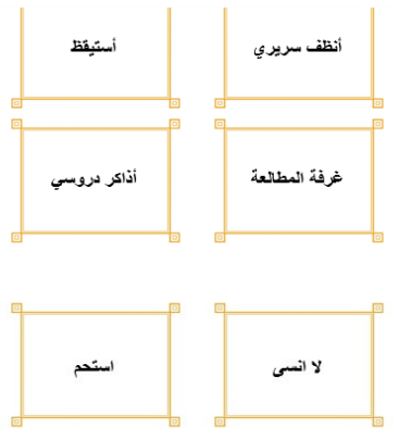
Gambar 2. Media Kartu Kata dengan tema pembelajaran اعملي اليومية

juga kalimat penjelas dalam teks bahasa Arab (Tichlova & Irhamni, 2021). Dalam kegiatan pembelajaran, terdapat tiga komponen, yaitu pembuka, inti, dan penutup. Kegiatan pembuka dilakukan selama sepuluh menit meliputi kegiatan (1) guru mengucapkan salam, (2) guru melakukan apersepsi kepada siswa, (3) guru menjelaskan tujuan kegiatan pembelajaran, kegiatan selanjutnya yaitu (4) kegiatan inti yang dilakukan selama 35 menit dengan menggunakan media kartu kata. Gambar di bawah adalah contoh untuk media kartu kata dan penjelasan cara penggunaannya