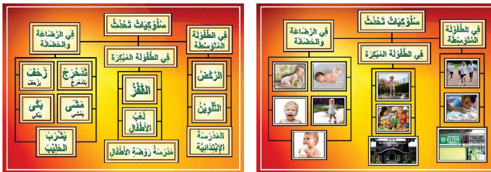
Gambar 8. Tampilan kartu kata dan gambar dalam bentuk peta konsep pada pertemuan 6