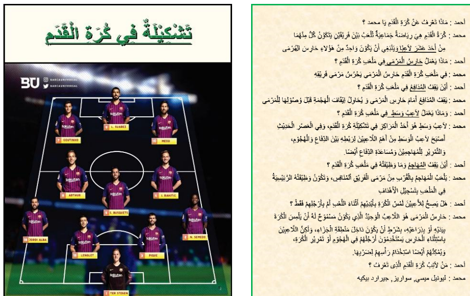
Gambar 5. Tampilan gambar formasi/posisi pemain sepak bola dan teks hiwar pada pertemuan 3

Contoh tampilan kartu kata dan gambar berbentuk peta konsep dan per kata (mufrodlat) tersebut adalah tema أنواع الرياضة dan القدم كرة pada materi bab 1 pertemuan ke 1 dan 2 serta pada pertemuan ke 3 adalah tema تشكيلة كرة في تشكيلة yaitu gambar formasi/posisi pemain sepak bola dan