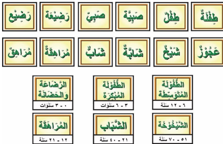
Gambar 7. Tampilan kartu kata dan gambar per kata (mufrodat) pada pertemuan 5 (Lanjutan)