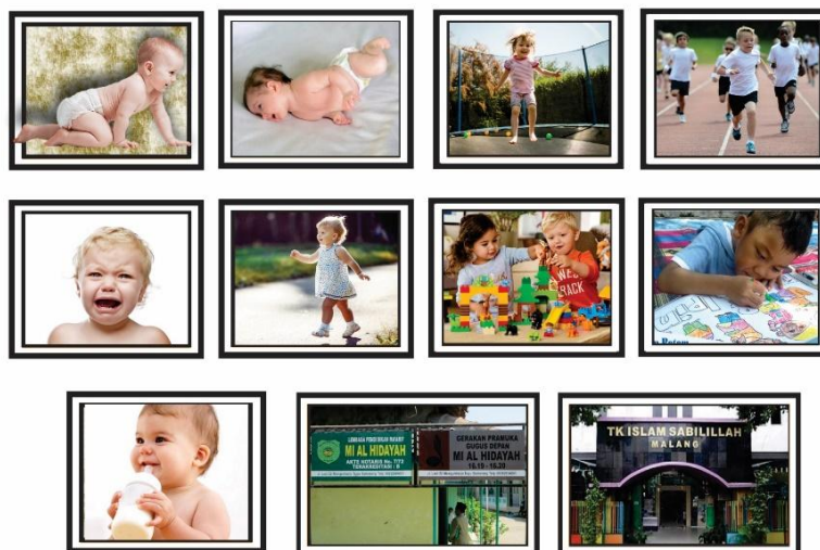
Gambar 9. Tampilan kartu kata dan gambar per kata (mufrodat) pada pertemuan 6