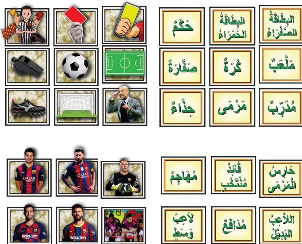
Gambar 4. Tampilan kartu kata dan gambar per kata (mufrodlat) pada pertemuan 2