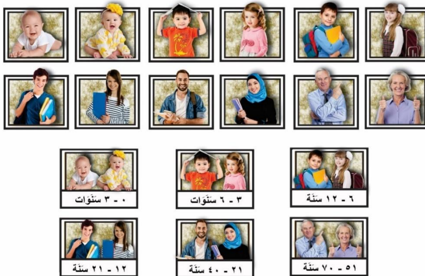
Gambar 7. Tampilan kartu kata dan gambar per kata (mufrodats) pada pertemuan 5