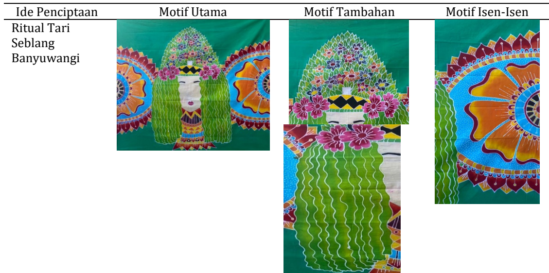
Tabel 4. Struktur perwujudan bentuk utama, bentuk tambahan, dan isen isen

Tahap yang terakhir adalah tahap ploroon, dilakukan dengan mencelupkan kain secara perlahan ke dalam panci yang sudah terisi air mendidih. Kain dinaik turunkan dan diaduk secara perlahan sampai kain bersih dari malam. Setelah itu dibilas dengan air bersih dan selanjutnya proses penjemuran dengan cara diangin-anginkan. Proses finishing karya ditambahkan manik-manik sebagai penambah estetika dari karya Batik Lukis ini.