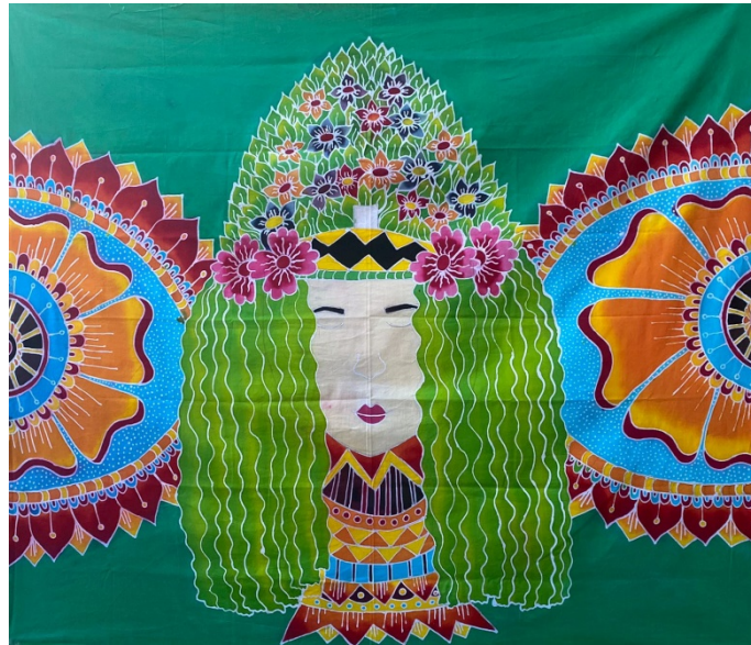
Gambar 11. Karya Ison Seblang 3

Judul Karya : Ison Seblang 3 Ukuran : 115 x 100 cm Bahan : Remasol dan Kain Primisima Tahun : 2022