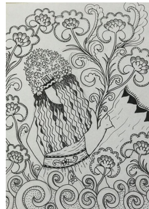
Gambar 8. Sketsa terpilih Ison Seblang 6

Pada proses Eksplorasi awal peneliti memvisualkan gagasan ide penciptaan menjadi suatu bentuk karya dengan berbagai kemungkinan bentuk dan kegiatan gambar sketsa alternatif. Gambar sketsa alternatif bertujuan untuk mencari kemungkinan bentuk imajinasi peneliti. Ketika dalam proses awal ini tumbuh kreativitas baru yang memungkinkan dapat menguatkan sumber ide yang sudah terkonsep. Kegiatan ini dilakukan dengan melakukan proses gambar sketsa berbagai alternatif yang mana gambar sketsa tersebut berupa estimasi – estimasi bentuk karya yang dituangkan dalam bentuk dua dimensi menggunakan gambar kertas di atas pensil.