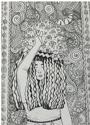
Gambar 7. Sketsa terpilih Ison Seblang 5