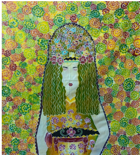
Gambar 9. Karya Ison Seblang 1

Judul Karya : Ison Seblang 1 Ukuran : 100 x 115 cm Bahan : Remasol dan Kain Primisima Tahun : 2022