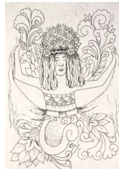
Gambar 6. Sketsa terpilih Ison Seblang 4