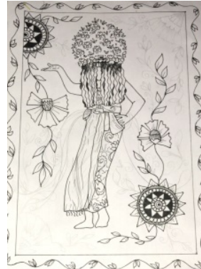
Gambar 4. Sketsa terpilih Ison Seblang 2