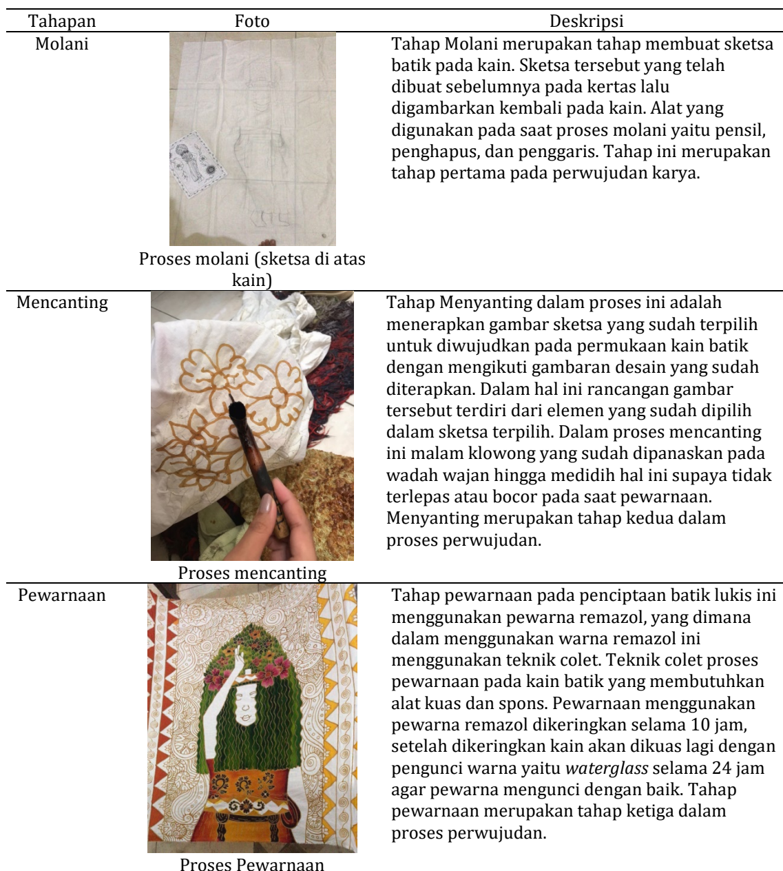
Tabel 1. Proses Penciptaan Karya

Pada Eksplorasi visual peneliti mencoba mengangkat tema yang berkaitan pada aspek gerak visual pada saat penari melakukan proses untuk memulai ritual seblang. Pada proses ini peneliti mengamati secara langsung objek di lapangan, di situlah peneliti tumbuh imajinasi yang didorong oleh kejadian yang sesungguhnya. Seorang penari yang akan memulai Ritual Tari Seblang hingga kesurapan, peneliti mensketsa secara langsung keadaan yang ada di lapangan setelah itu dituangkanke dalam kain yang disebut sebagai molani. Selanjutnya pada tahap prancangan peneliti melakukan proses penciptaan karya dengan langkah-langkah sebagai berikut: