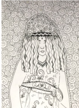
Gambar 3. Sketsa terpilih Ison Seblang 1

dimana menggunakan tiga tahapan yaitu eksplorasi, perancangan, dan pembentukan (Gustami, 2004). Setelah melakukan tahap eksplorasi diketahui bahwa peneliti mengambil sumber ide tari Seblang dalam bentuk perwujudan batik lukis. Adapun sketsa dalam prose penciptaan batik lukis, sebagai berikut: