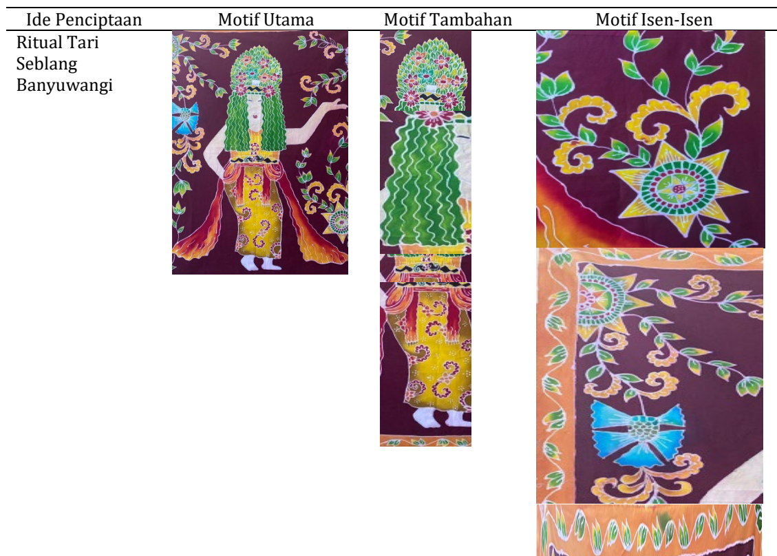
Tabel 3. Struktur Perwujudan Bentuk utama, Bentuk Tambahan, dan isen isen

Tahap yang terakhir adalah tahap ploroon, dilakukan dengan mencelupkan kain secara perlahan kedalam panci yang sudah terisi air mendidih. Kain dinaik turunkan dan diaduk secara perlahan sampai kain bersih dari malam. Setelah itu di bilas dengan air bersih dan selanjutnya proses penjemuran dengan cara diangin-anginkan. Proses finishing karya ditambahkan manik-manik sebagai penambah estetika dari karya Batik Lukis ini.