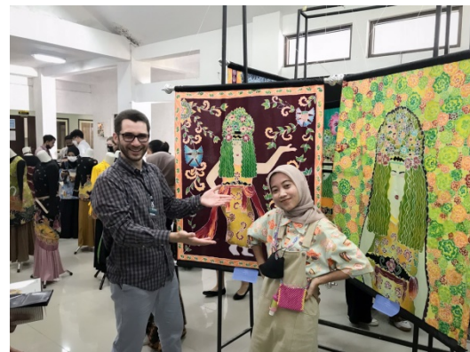
Gambar 16. Pelaksanaan Pameran