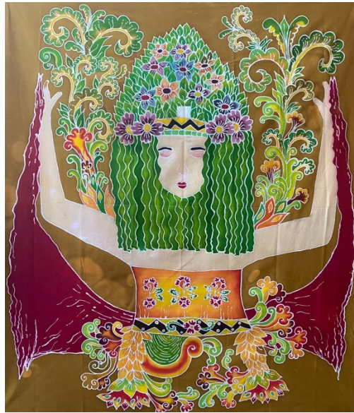
Gambar 12. Karya Ison Seblang 4

Judul Karya : Ison Seblang 4 Ukuran : 100 x 115 cm Bahan : Remasol dan Kain Primisima Tahun : 2022