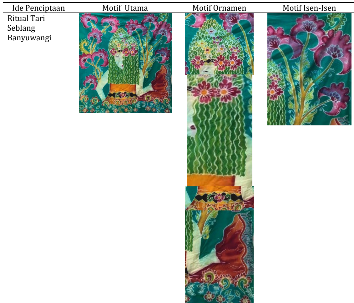
Tabel 7. Struktur perwujudan bentuk utama, bentuk tambahan dan isen isen

Tahap yang terakhir adalah tahap ploroon, dilakukan dengan mencelupkan kain secara perlahan ke dalam panci yang sudah terisi air mendidih. Kain dinaik turunkan dan diaduk secara perlahan sampai kain bersih dari malam. Setelah itu dibilas dengan air bersih dan selanjutnya proses penjemuran dengan cara diangin-anginkan. Proses finishing karya ditambahkan manik-manik sebagai penambah estetika dari karya Batik Lukis ini.