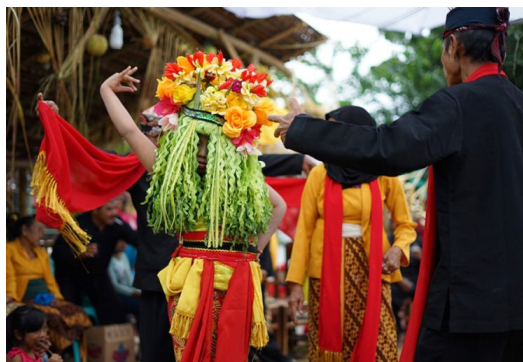
Gambar 1. Tari Seblang

Karya seni batik merupakan salah satu elemen dari seni rupa. Terdiri dari kata “amba” berarti menulis dan kata “tik” yang artinya titik. (Dewi et al., 2016). Batik memiliki ragam motif yang berbeda-beda pada tiap daerahnya. Setiap motif memiliki ciri khas yang menyimbolkan ragam budaya masing-masing daerah tersebut. (Meccasia et al., 2015). Batik di Banyuwangi merupakan jenis batik pesisiran yang memiliki khas dari segi bahan baku, motif, dan batik yang melampui batik keraton yang batiknya untuk dikembangkan sebagai inovasi pada motif batik pesisiran (Qiram et al., 2018). Batik dimasa sekarang sudah banyak inovasi terlebih dari segi teknik pembuatannya, batik di Indonesia ada beberapa jenis yaitu batik tulis, batik cap, batik printing, dan batik lukis (Sari & Prihatina, 2015).