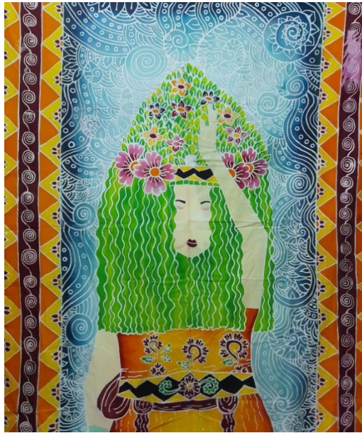
Gambar 13. Karya Ison Seblang 5

Judul Karya : Ison Seblang 5 Ukuran : 100 x 115 cm Bahan : Remasol dan Kain Primisima Tahun : 2022