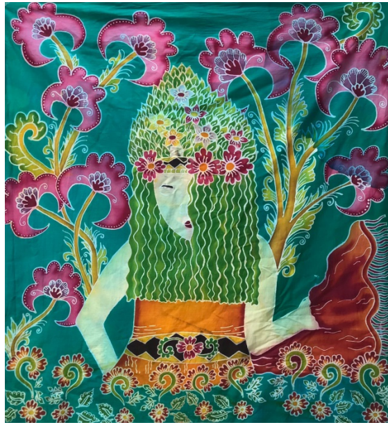
Gambar 14. Karya Ison Seblang 6

Judul Karya : Ison Seblang 6 Ukuran : 100 x 100 cm Bahan : Remasol dan Kain Primisima Tahun : 2022