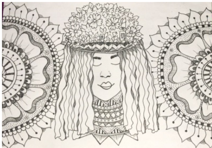
Gambar 5. Sketsa terpilih Ison Seblang 3