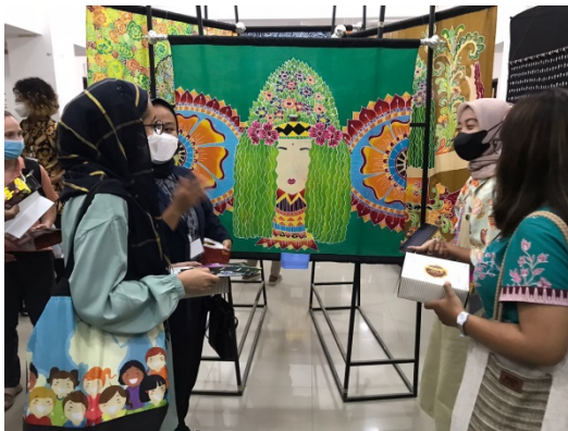
Gambar 15. Pelaksanaan Pameran

Karya-karya batik lukis yang telah diciptakan selanjutnya akan dipresentasikan dan dipamerkan. Pelaksanaan gelar pameran di Gedung Selasar D18 Fakultas Sastra, Universitas Negeri Malang. Pameran berlangsung dalam dua hari yaitu pada tanggal 17 dan 20 Juni 2022. Pameran dilaksanakan bersamaan dengan empat mahasiswa, kritik, dan saran penikmat seni merupakan tujuan utama dari diadakan pameran. Para pencipta membutuhkan kritik dan saran yang membangun agar bisa mengevaluasi atau mengembangkan karya - karya pencipta. Berikut dokumentasi pameran: