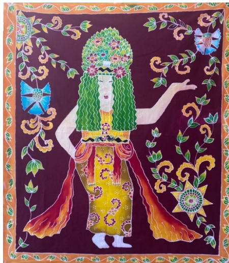
Gambar 10. Karya Ison Seblang 2

Judul Karya : Ison Seblang 2 Ukuran : 100 x 115 cm Bahan : Remasol dan Kain Primisima Tahun : 2022