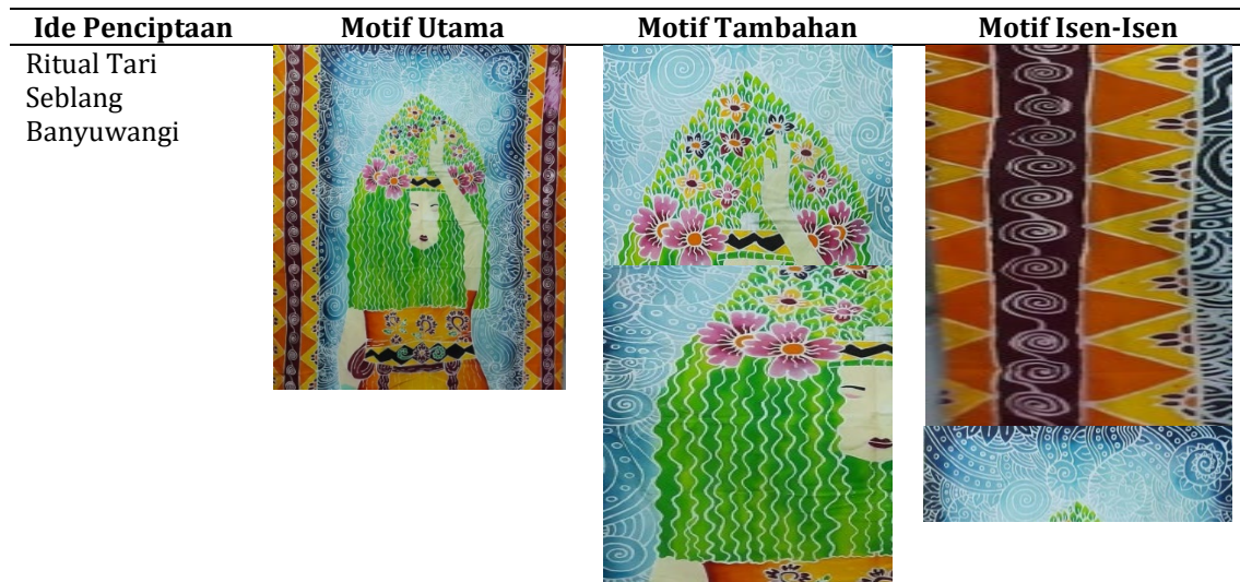
Tabel 6. Struktur perwujudan bentuk utama, bentuk tambahan, dan isen isen

Tahap yang terakhir adalah tahap ploroon, dilakukan dengan mencelupkan kain secara perlahan ke dalam panci yang sudah terisi air mendidih. Kain dinaik turunkan dan diaduk secara perlahan sampai kain bersih dari malam. Setelah itu dibilas dengan air bersih dan selanjutnya proses penjemuran dengan cara diangin-anginkan. Proses finishing karya ditambahkan manik-manik sebagai penambah estetika dari karya Batik Lukis ini.