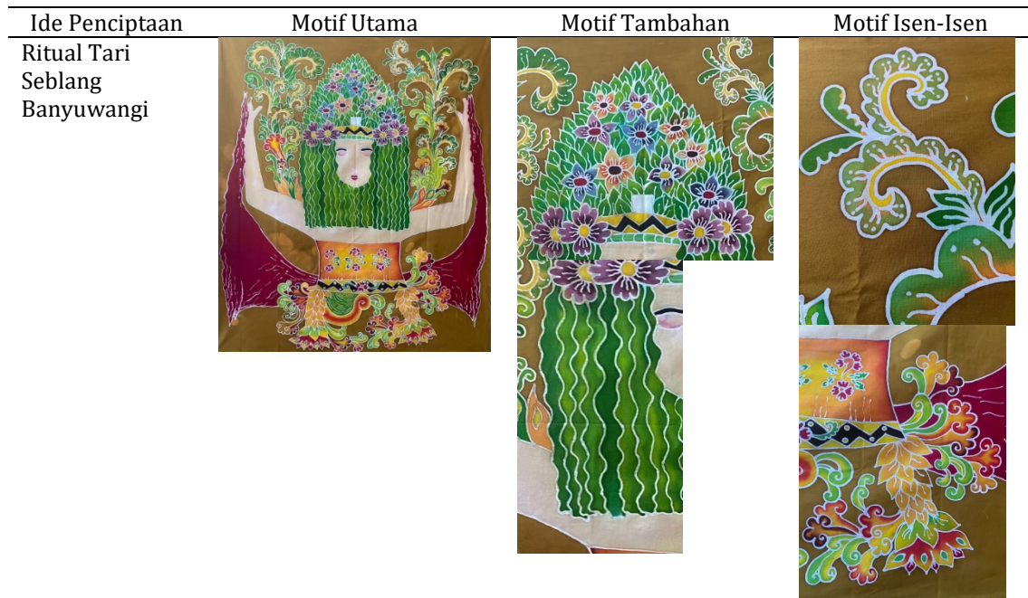
Tabel 5. Struktur perwujudan bentuk utama, bentuk tambahan, dan isen isen

Tahap yang terakhir adalah tahap ploroon, dilakukan dengan mencelupkan kain secara perlahan ke dalam panci yang sudah terisi air mendidih. Kain dinaik turunkan dan diaduk secara perlahan sampai kain bersih dari malam. Setelah itu dibilas dengan air bersih dan selanjutnya proses penjemuran dengan cara diangin-anginkan. Proses finishing karya ditambahkan manik-manik sebagai penambah estetika dari karya Batik Lukis ini.