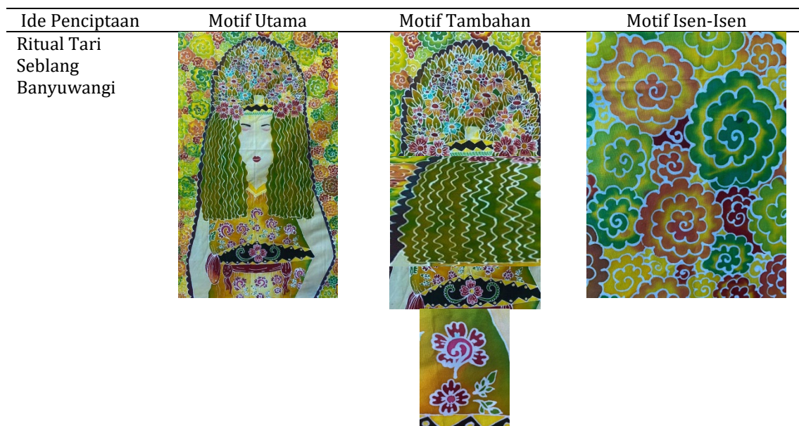
Tabel 2. Struktur penciptaan bentuk utama, bentuk tambahan, dan isen isen

Tahap yang terakhir adalah tahap ploroan, dilakukan dengan mencelupkan kain secara perlahan kedalam panci yang sudah terisi air mendidih. Kain dinaik turunkan dan diaduk secara perlahan sampai kain bersih dari malam. Setelah itu dibilas dengan air bersih dan selanjutnya proses penjemuran dengan cara diangin-anginkan. Proses finishing karya ditambahkan manik-manik sebagai penambah estetika dari karya Batik Lukis ini.