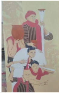
Karya 1 : Junjung-junjung