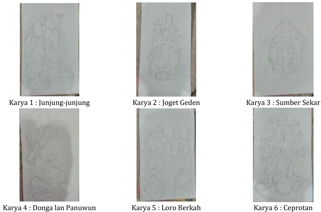
Gambar 4. Proses sketsa karya penciptaan

terkesan kosong dengan memberi hiasan ataupun corak sehingga lebih terkesan dekoratif. Berikut penjelasan dari tahapan pembentukan: