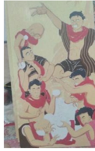
Karya 5 : Loro Berkah