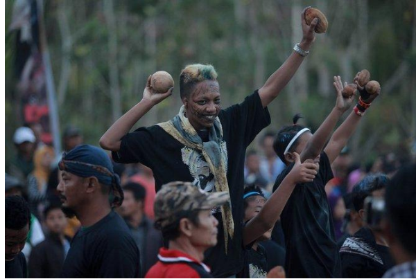
Gambar 1. Upacara adat Ceprotan

Tujuan utama dari pelaksanaan tradisi upacara adat ini adalah sebagai wujud rasa syukur juga diyakini dapat menjauhkan desa tersebut dari bala serta memperlancar kegiatan pertanian yang menjadi mata pencaharian utama warga. Selain daripada itu, upacara adat ini tidak hanya dilaksanakan untuk mengingat pendahulu desa dan meminta keselamatan saja, tetapi juga sebagai pendidikan budaya terhadap generasi muda tentang asal muasal desa tersebut (Mustaqim dkk., 2020). Meskipun warga Desa Sekar sebagian besar telah menerima kepercayaan Islam, nyatanya warga Desa Sekar masih tetap menjunjung tinggi warisan budaya dari nenek moyang. Hal itu terlihat jelas pada kehidupan masyarakat Desa Sekar yang masih melakukan bentuk-bentuk ritual seperti menyalakan kemenyan, memberi sesajen pada hari-hari yang dianggap keramat.