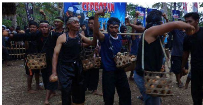
Gambar 2. Upacara adat ceprotan

Masyarakat Desa Sekar hingga saat ini masih sangat menjaga warisan budaya yang dimiliki oleh Desa Sekar sendiri. Oleh karena itu Upacara Adat Ceprotan ini masih dilestarikan hingga sekarang. Adapun tata pelaksanaan Upacara Adat Ceprotan ini dimulai dengan pengarakannya kelapa muda " cengkir " atau yang digunakan sebagai alat " Ceprotan " menuju tempat dilaksanakannya upacara yang biasanya berupa tanah lapang dengan dibawa oleh pemuda setempat. Hingga pada prosesi akhir sebagai puncak acara pada Upacara Adat Ceprotan berupa pelemparan kelapa.