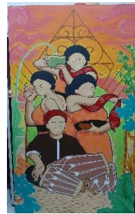
Karya 2 : Joget Geden