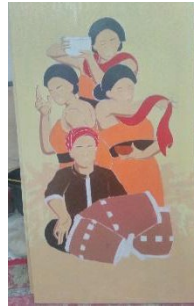
Karya 2 : Joget Geden