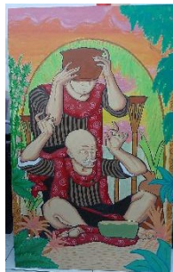
Karya 4 : Donga lan Panuwun