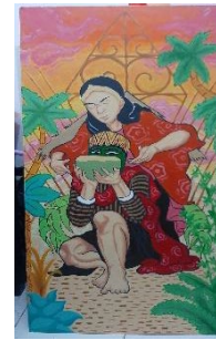
Karya 3 : Sumber Sekar