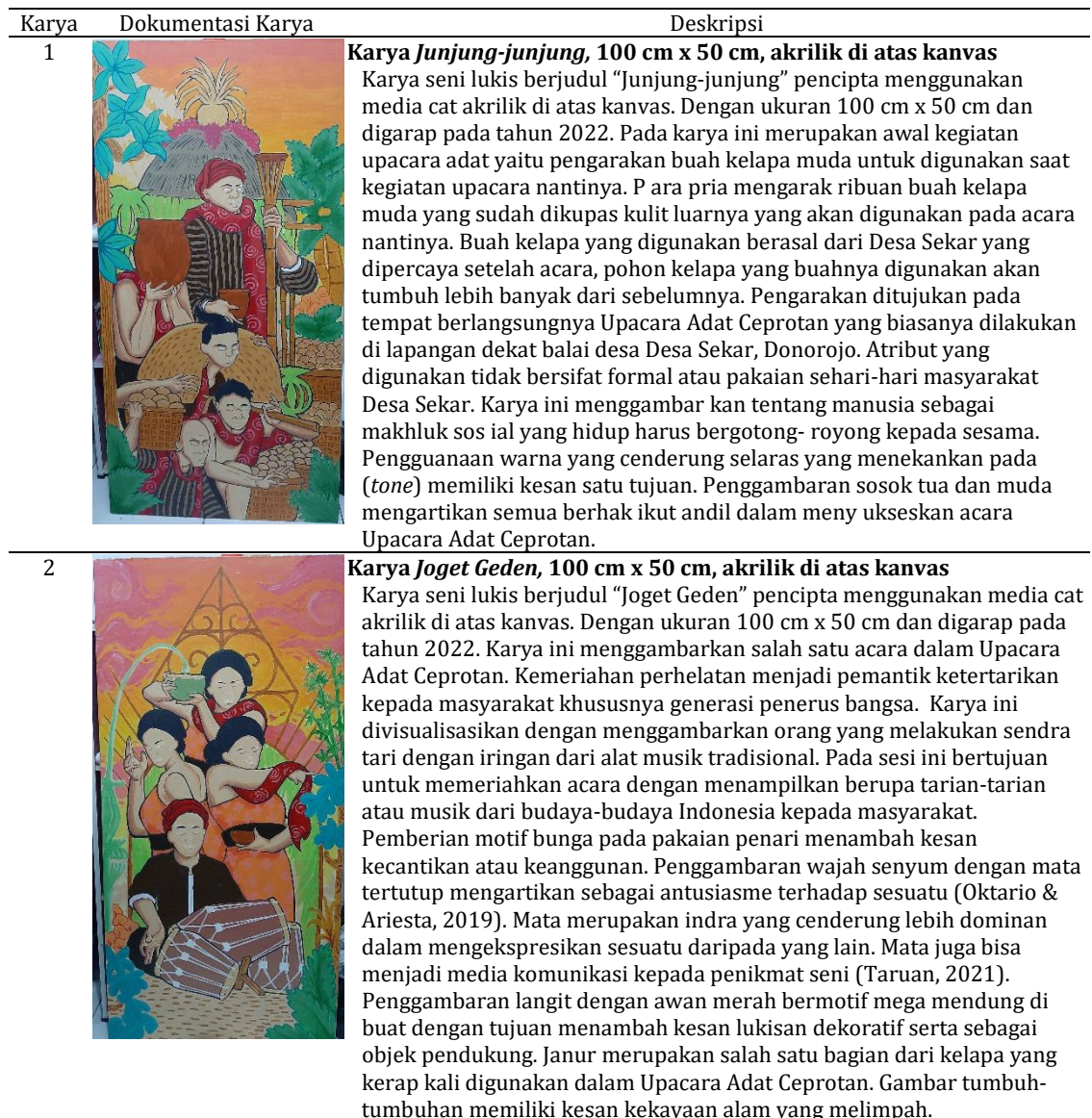
Tabel 1. Hasil karya penciptaan

Karya ini menceritakan bagaimana proses berlangsungnya Upacara Adat Ceprotan. Penciptaan divisualisasikan ke dalam seni lukis secara berurutan sehingga para penikmat seni serta masyarakat lebih mudah memahami ataupun menerima pesan yang terdapat dalam lukisan ini. Berikut adalah gambaran ke enam karya lukis Upacara Adat Ceprotan :