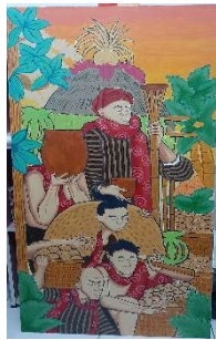
Karya 1 : Junjung-junjung

Pewarnaan karya ini menggunakan teknik opaque , di mana dalam pengertiannya merupakan pewarnaan yang cenderung menutup, tidak tembus pandang, dan bersifat tebal. Penorehan warna dimulai dari warna yang terang menuju ke warna gelap serta dari objek yang dirasa paling jauh ke yang paling dekat. Hal itu dilakukan supaya meminimalisir kesalahan dalam proses pewarnaan. Pewarnaan juga selalu dicampur dengan warna putih guna memberikan kesan selaras antar warna satu dengan yang lainnya.