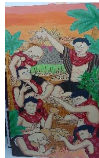
Karya 5 : Loro Berkah