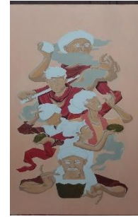
Karya 6 : Ceprotan