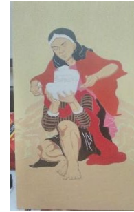
Karya 3 : Sumber Sekar