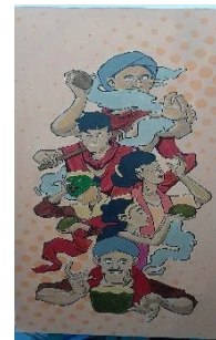
Karya 6 : Ceprotan