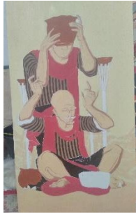
Karya 4 : Donga lan Panuwun