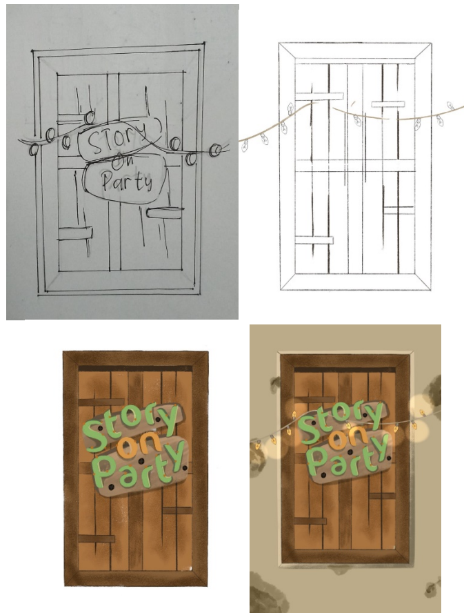
Gambar 3. Perancangan Ilustrasi Packaging

Setelah point-point sudah terpenuhi maka selanjutnya dilakukan tahap sketsa, line art , coloring , dan finishing . Ilustrasi ini nantinya akan di implementasikan pada media-media board game contohnya packaging atau box . Karena board game ini berlatar belakang rumah maka visual dari permainannya akan lebih banyak berupa gambaran bagian pada rumah contoh ruang tamu, ruang keluarga, sofa, meja dan lain sebagainya.