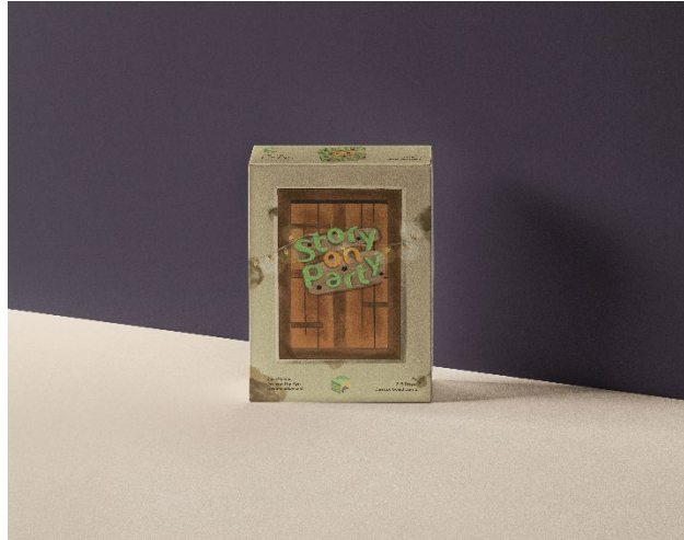
Gambar 4. Mockup Packaging Board Game Story on Party

Setelah visual selesai nantinya akan dilakukan pengimplementasian di media-media board game story on party . Pengimplementasian tersebut dilakukan pada beberapa media penunjang game diantaranya papan, kartu, kupon, koin, bidak, buku panduan dan media pendukung hukuman yaitu tompel. Namun dalam pembuatannya perlu dilakukan penentuan kata kunci packaging dengan cara brainstorming dan layouting terlebih agar dalam pembuatannya nanti sesuai dengan tujuan awal.