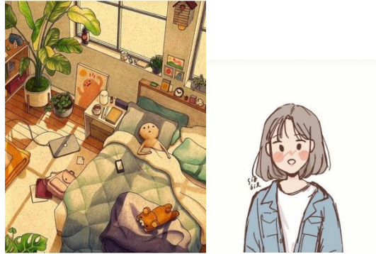
Gambar 2. Moodboard Style Ilustrasi (sumber: id.pinterest.com)

Setelah point-point sudah terpenuhi maka selanjutnya dilakukan tahap sketsa, line art , coloring , dan finishing . Ilustrasi ini nantinya akan di implementasikan pada media-media board game contohnya packaging atau box . Karena board game ini berlatar belakang rumah maka visual dari permainannya akan lebih banyak berupa gambaran bagian pada rumah contoh ruang tamu, ruang keluarga, sofa, meja dan lain sebagainya.