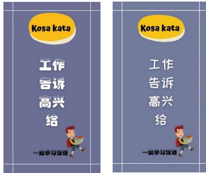
Gambar 6. Revisi jenis font sebelum dan sesudah direvisi

kebingungan dalam membaca aksara hanzi . Peneliti melakukan revisi berdasarkan saran dari subjek uji coba skala kecil sebelum melakukan implementasi.