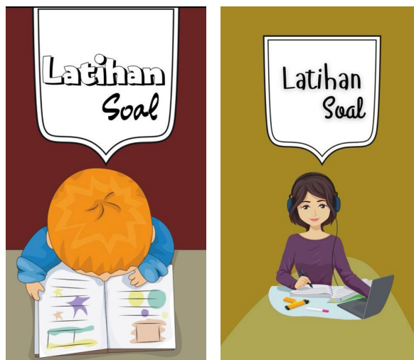
Gambar 1. Tampilan white space sebelum dan sesudah revisi

Gambar 2 terlihat bahwa font pada pinyin tidak sama sehingga ahli media memberikan saran agar menggunakan font yang sama dan tidak terlalu banyak. Sebelum revisi font yang digunakan ialah " bryndan write " sehingga font pada pinyin terlihat kurang sesuai, setelah revisi font yang digunakan ialah "汉仪李政恩小楷". Setelah direvisi font menjadi lebih mudah dibaca dan terlihat lebih menarik. Kemudian gambar 3 ahli media menyarankan untuk memperbaiki kata yang salah pada petunjuk penggunaan yaitu nomor 2 pada kata unduh menjadi unduh.