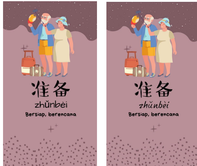
Gambar 2. Tampilan font sebelum dan sesudah revisi