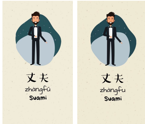
Gambar 4. Tampilan pinyin sebelum dan sesudah direvisi

语[yīqǐ xuéxí hànyǔ] (Belajar Mandarin Bersama) membantu siswa dalam pembelajaran mandiri. Jadi, dapat ditarik kesimpulan bahwa media video一起学习汉语 [yīqǐ xuéxí hànyǔ] (Belajar Mandarin Bersama) layak dengan revisi.