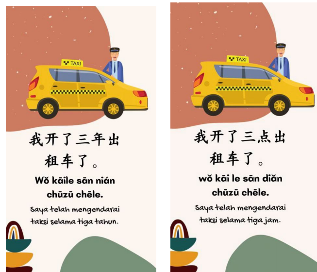
Gambar 5. Tampilan kalimat sebelum dan sesudah direvisi

Gambar 4 terlihat bahwa terdapat kesalahan pada tampilan kosakata pada penulisan pinyin . Sebelum revisi terlihat bahwa penulisan pinyin menggunakan nada empat dan satu ialah zhàngfū . Setelah dilakukan revisi pinyin sesuai dengan kebenaran bahasa Mandarin yaitu menggunakan nada empat tanpa menggunakan nada satu yaitu zhàngfu .