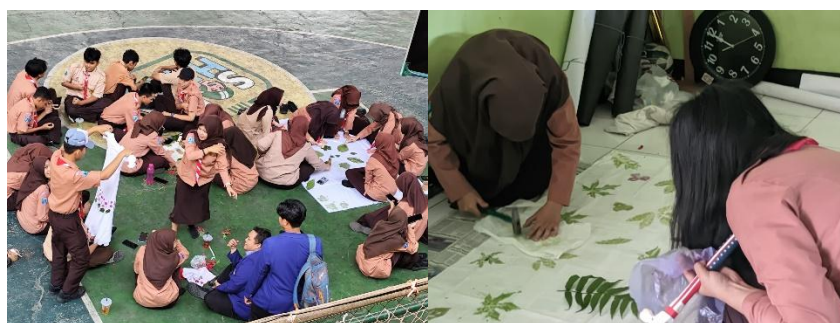
Gambar 2. Aktivitas P5 di SMA Negeri 9 Malang

Tahap selanjutnya adalah aksi yang merupakan inti dari pelaksanaan proyek, di mana peserta didik mulai melaksanakan rencana aksi yang telah disusun. Pada tahap ini peserta didik berpartisipasi aktif dalam berbagai kegiatan untuk mencapai tujuan proyek. Refleksi merupakan langkah terakhir, tujuannya untuk merenungkan proses dan hasil proyek. Peserta didik dan guru bersama-sama untuk mengevaluasi pembelajaran yang telah dilakukan, mengidentifikasi pencapaian dan kekurangan selama proyek. Tahap ini juga dapat memberikan pengalaman bagi guru untuk merancang proyek yang lebih baik lagi untuk kedepannya.