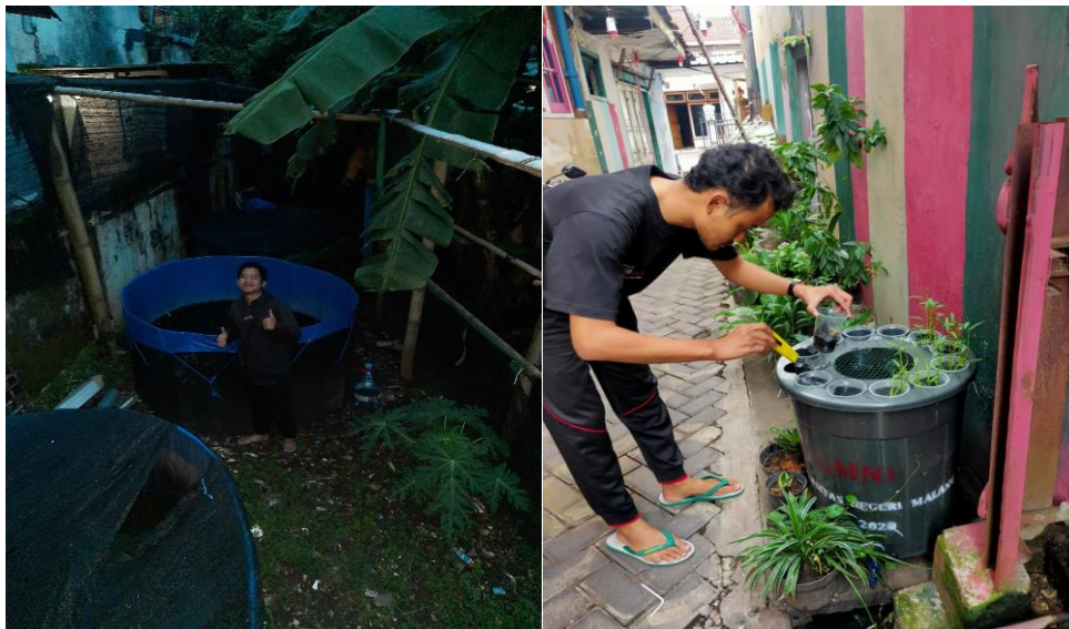
Gambar 5. Pembudidayaan Ikan Lele dalam Kolam dan Media Ember serta Dilakukannya Perawatan dan Pengecekan Berkala

Dari hasil observasi dan wawancara peneliti didapatkan bahwa pada masa pandemi masyarakat cenderung kesulitan untuk memperoleh ide agar kebutuhan pangan mereka meningkat. Hal tersebut diperkuat dengan beberapa hasil wawancara yang mana tiga narasumber mengatakan bahwa masyarakat pada saat itu sedang kesulitan untuk mempertahankan hajat hidupnya pada masa pandemi dikarenakan susah untuk beraktivitas normal akibat adanya kebijakan pembatasan sosial. Meskipun Komunitas Anak Merdeka telah menemukan solusi peningkatan ketahanan pangan dengan membudidayaan lele, namun tidak dipungkiri kegiatan jual beli pasar tradisional pada waktu itu juga mengalami penurunan yang diakibatkan adanya pembatasan sosial.