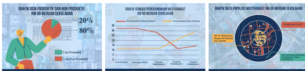
Gambar 1. Kondisi Sosial Masyarakat

Kelurahan Tanjungrejo adalah salah satu kelurahan yang berada di dalam Kecamatan Sukun, Kota Malang. Wilayah Kelurahan Tanjungrejo sendiri terdiri dari 138 RT dalam 13 RW. Batas wilayah bagian utara Kelurahan Tanjungrejo adalah Kelurahan Bareng, batas wilayah bagian timur berbatasan dengan Kelurahan Sukun, batas wilayah selatan berbatasan langsung dengan Bandungrejosari, dan batas wilayah barat yakni Kelurahan Bandulan ( profil Kelurahan Tanjungrejo, 2023 ).