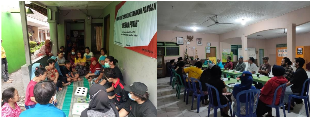
Gambar 7. Komunitas Anak Merdeka melakukan diskusi serta pemetaan potensi bersama warga Kampung Mergan Sekolahan RW 06 Kelurahan Tanjungrejo

Berdasarkan hasil observasi dan wawancara yang dilakukan oleh peneliti dapat diketahui bahwa langkah awal yang dilakukan oleh Komunitas Anak Merdeka terhadap warga RW 06 Kelurahan Tanjungrejo adalah memberikan semangat dan motivasi serta rembuk bersama untuk menentukan suatu tujuan juga melakukan observasi terhadap sumber daya yang ada dalam masyarakat dengan mengukur aspek apa saja yang perlu diprioritaskan untuk dikerjakan bersama masyarakat.