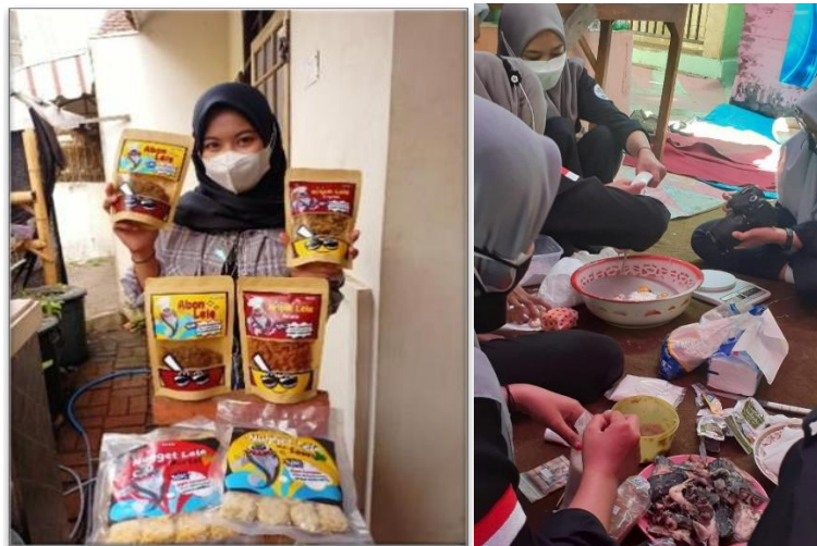
Gambar 6. Pembuatan Produk Pangan Alternatif Abon Lele

Dalam upaya peningkatan ketahanan pangan warga, Komunitas Anak Merdeka melalui programnya berusaha untuk membantu warga dalam meningkatkan produksi bahan olahan pangan yang kemudian dijual untuk meningkatkan perekonomian warga RW 06 Kelurahan Tanjungrejo. Pada kesempatan ini Komunitas Anak Merdeka memiliki andil untuk turut berinovasi mengembangkan produk pangan alternatif menggunakan bahan dasar lele berupa abon lele.