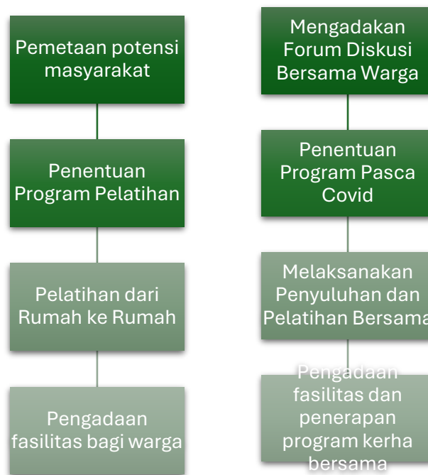
Gambar 4. Alur Strategi Covid-19 (Kiri) dan Pasca Covid (Kanan)

Strategi yang digunakan Komunitas Anak Merdeka saat kondisi Covid-19 diawali dengan pemetaan potensi masyarakat yang dilakukan secara online dengan beberapa warga yang terlibat langsung hingga menemukan sasaran serta bentuk program pelatihan yang akan dijalankan untuk menambah pengetahuan masyarakat terlebih dahulu. Setelah program pelatihan sudah disepakati bersama, Komunitas Anak Merdeka mengadakan serangkaian pelatihan kepada warga dengan mempertimbangkan kondisi Covid-19 pada waktu itu yang akhirnya sistem pelatihannya dilakukan dari rumah ke rumah agar lebih intens selama kurang lebih satu bulan. Setelah program pelatihan selesai dijalankan, Komunitas Anak Merdeka melakukan serangkaian pengadaan fasilitas kepada warga yang diantaranya berupa ember serta bibit sayuran (pakcoy dan kangkung) dan bibit ikan lele untuk keperluan budaya ikan dalam ember serta pembudidayaan sayur pakcoy dan kangkung pada ember. Monitoring dan evaluasi dilakukan oleh Komunitas Anak Merdeka setiap akhir pekan agar kendala yang ada dapat diselesaikan dengan baik sehingga pada nantinya program yang dilaksanakan ini dapat berjalan dengan tepat sasaran.