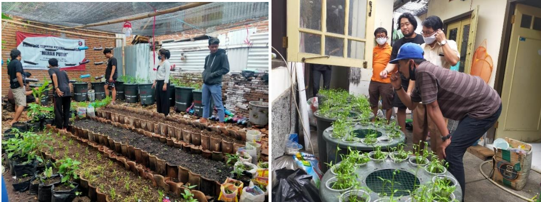
Gambar 3. Proses Pemberdayaan Berkonsep Ketahanan Pangan Komunitas Anak Merdeka bersama Warga

Fokus area kedua adalah ketahanan pangan dan lingkungan hidup. Komunitas Anak Merdeka memmanifestasikan fokus tersebut dalam suatu program yang bertujuan untuk mewujudkan ketahanan pangan dalam masyarakat perkotaan dengan konsep green house yang dapat dikelola secara swadaya oleh masyarakat sekitar. Komunitas Anak Merdeka sangat memperhatikan partisipasi masyarakat sebagai modal sosial guna mengoptimalkan keterlaksanaan program di fokus ini.