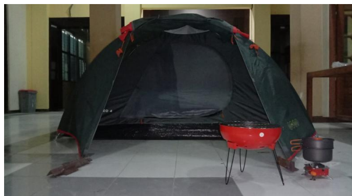
Gambar 10. Gambar Pemasangan Tenda dan Kelengkapannya