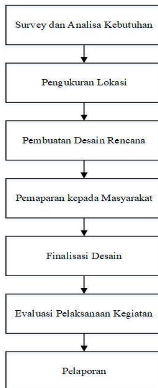
Gambar 5. Diagram Tahapan Pelaksanaan Program

Metode pelaksanaan kegiatan pengabdian kepada masyarakat ini dibagi menjadi 3 tahapan meliputi: (1) persiapan, (2) pelaksanaan, (3) evaluasi, dan laporan. Tahapan pelaksanaan tersebut secara sistematis digambarkan dalam diagram alir seperti berikut ini: