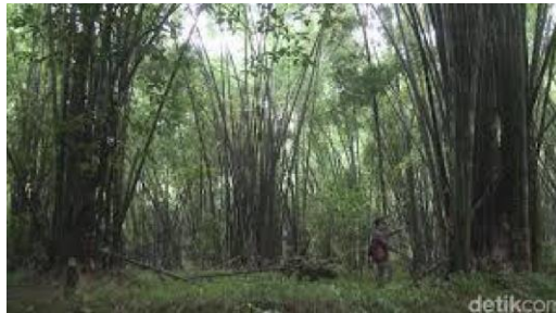
Gambar 1. Potensi Wisata 1000 Bambu

Desa ini memiliki tipografi ketinggian desa adalah berupa dataran sedang yaitu dengan ketinggian sekitar 700 m diatas permukaan air laut, kondisi alam sekitar yang ada di desa masih sangatlah sejuk. Masih terdapat banyak lahan di desa ini seperti 294,720 Ha area perkebunan, 1,650 Ha tanah wakaf dan 26,402 Ha hutan produksi, dan juga terdapat hutan bambu (Kosanke, 2019). Potensi perkebunan, perhutanan, edukasi alam, 1000 bambu, dan adventure yang ditunjukkan pada Gambar 1, Gambar 2, Gambar 3, dan Gambar 4 berikut ini.