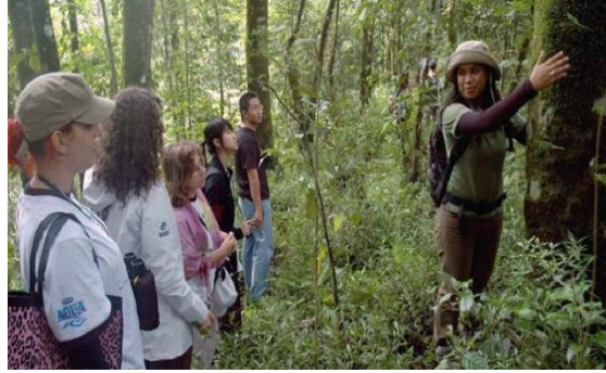
Gambar 4. Potensi Wisata “P-Wec”

Seluruh potensi wisata ini menjadikan peluang bagi Desa Petungsewu untuk berkembang menjadi desa wisata (Pujaastawa & Arida, 2015). Letak desa yang strategis dan kondisi alam yang masih asri, desa ini dapat dikategorikan sebagai kawasan singgah wisatawan (Chaerunissa & Yuniningsih, 2020). Hal lainnya adalah belum tersedia penginapan atau tempat berkemah disekitar wisata alam, sehingga wisata alam di Desa Petungsewu dapat dioptimalkan menjadi tempat berkemah yang kekinian serta nyaman sebagai tempat kumpul keluarga (Abbas et al., 2017; Rinaldi, 2015). Pengimplementasian rencana pembuatan tempat berkemah disekitar wisata alam Desa Petungsewu dapat dituangkan dengan pembuatan konsep Family Fun Camp (FFC) dimana FFC nantinya adalah wisata bumi perkemahan yang ada di Desa Petung Sewu Kecamatan Dau Kabupaten Malang (Hadiwijoyo, 2012; Kebaman, 2020).