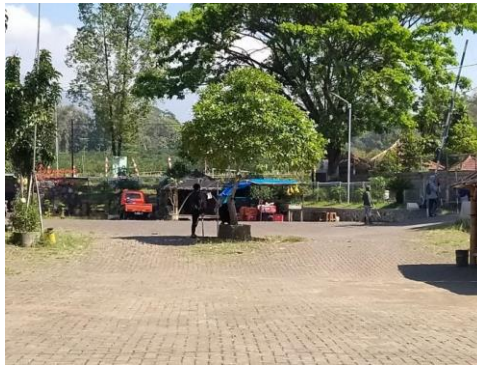
Gambar 6. Kegiatan Survey ke Patungsewu

Survei dilakukan bertujuan untuk mengetahui kondisi riil lokasi kegiatan ini. Survei dilaksanakan dengan melakukan wawancara dengan pengelola kawasan wisata serta pejabat setempat. Wawancara dilakukan untuk memperoleh informasi mengenai rencana pengembangan lokasi wisata alam di Desa Petungsewu, Kecamatan Dau sehingga dapat dijadikan bahan dalam membuat bumi perkemahan dengan konsep Family Fun Camp (FFC).