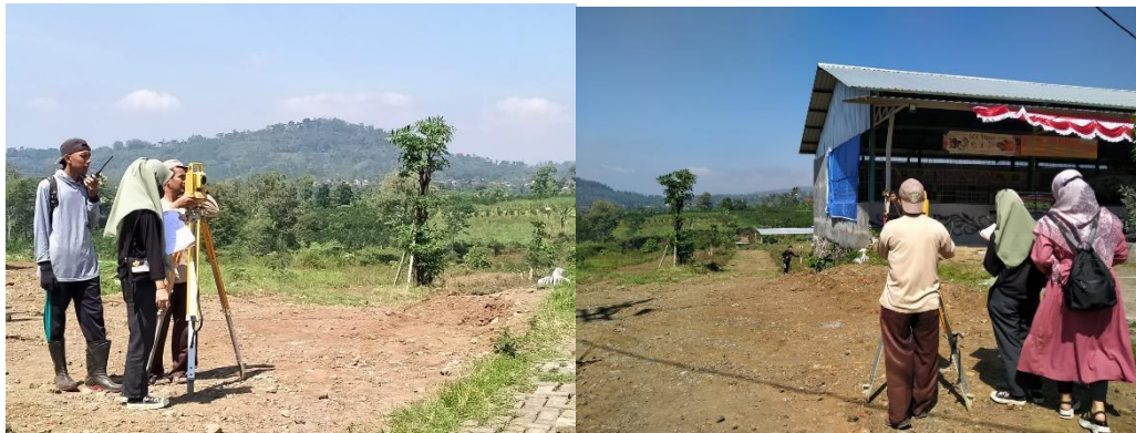
Gambar 7. Kegiatan Pengukuran di Desa Petungsewu