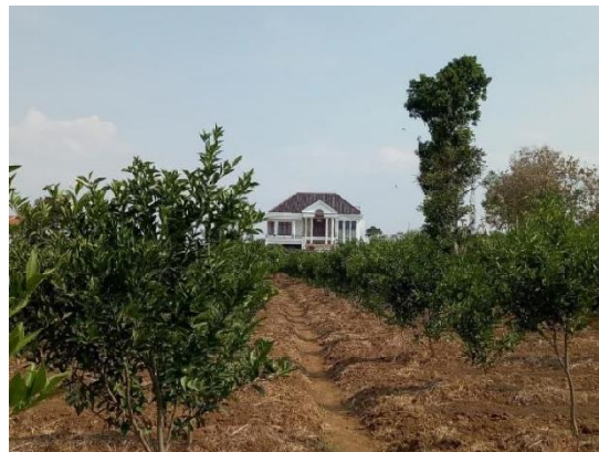
Gambar 3. Potensi Perkebunan Jeruk Desa Petungsewu