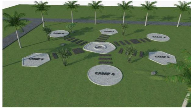
Gambar 9. Gambar Desain Konsep Rabatan Alas untuk Family Fun Camp di Desa Petungsewu