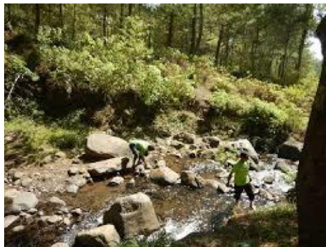
Gambar 2. Potensi Petungsewu Adventure