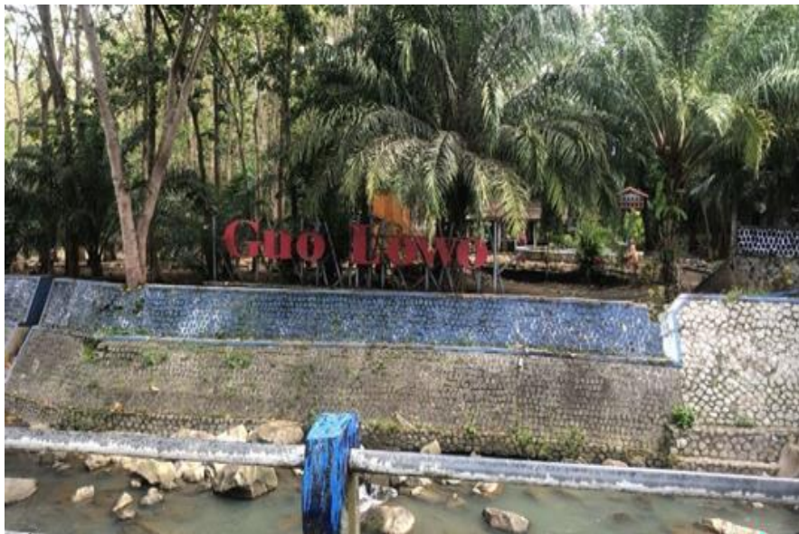
Gambar 3. Objek Wisata Goa Lowo

Asesmen potensi geopark yang dilakukan dalam penelitian ini menggunakan metode deskriptif kuantitatif yang menghasilkan asesmen kelayakansuatu daerah untuk ditetapkan menjadi geopark yang berdasarkan empat parameter yaitu nilai sains, nilai pendidikan, nilai pariwisata, dan nilai risiko degradasi. Berdasarkan hasil asesmen yang telah dilaksanakan, didapatkan bahwa terdapat kelebihan dan kekurangan yang dimiliki daerah penelitian sebagai daerah geopark.