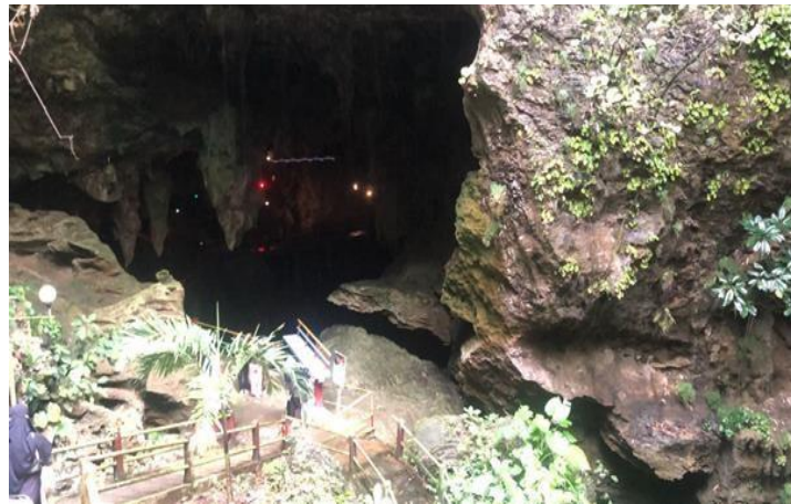
Gambar 8. Objek Wisata Goa Lowo dapat Dikembangkan Menjadi Geopark

Tabel 8 menjelaskan persentase berbagai kriteria atau standar yang digunakan untuk melakukan asesmen situs warisan geologi berdasarkan nilai risiko degradasi pada geosite Goa Lowo mencapai bobot 58,75%. Kerusakan terhadap unsur geologi 26,25%, berdekatan dengan daerah/aktivitas yang berpotensi menyebabkan degradasi 15%, perlindungan hukum 5%, aksesibilitas 7,5%, dan kepadatan populasi 5%.