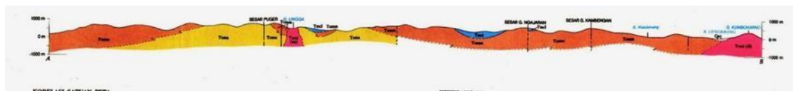
Gambar 2. Penampang Formasi Geologi Kabupaten Trenggalek

Berdasarkan hasil observasi di lapangan, lokasi objek wisata Goa Lowo banyak dijumpai beberapa litologi dan struktur geologi yang terus mengalami perkembangan. Secara litologi daerah ini terdiri atas batuan karst bertekstur kasardengan warna putih kecoklatan, dengan struktur masif. Jika dilihat dari aspek stratigrafi pegunungan selatan Jawa, daerah ini terdiri dari endapan vulkanik berumur miosen yang telah terangkat dan tererosi. Formasi geologi daerah ini didominasi dua litologi yang saling melengkapi, yaitu Formasi Mandalika dan Formasi Arjosari. Formasi ini terdiri dari lava andesit, vulkanik breksi, aliran breksi lahar, dan batuan sedimen.