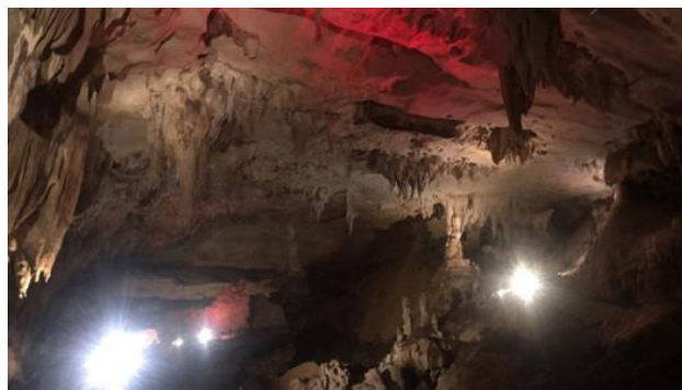
Gambar 7. Goa Lowo Salah Satu Goa Terbesar di Asia Tenggara

Tabel 7 menjelaskan persentase berbagai kriteria atau standar yang digunakan untuk melakukan asesmen situs warisan geologi berdasarkan nilai pariwisata pada geosite Goa Lowo mencapai bobot 87,5%. Nilai kerentanan sebesar 7,5%, aksesibilitas lokasi 7,5%, hambatan pemanfaatan lokasi 2,5%, fasilitas keamanan 7,5%, sarana pendukung 3,75%, kepadatan penduduk 2,5%, hubungan dengan nilai lainnya 3,75%, status lokasi 15%, kekhasan sebesar 10%, kondisi pada pengamatan elemen geologi sebesar 7,5%, potensi interpretatif 5%, tingkat ekonomi 10%, dan nilai berdekatan dengan area rekreasi 5%.