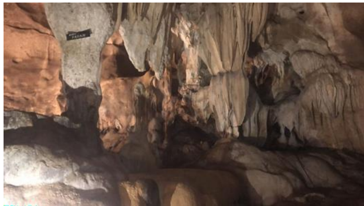
Gambar 4. Stalakmit dan Stalaktit di Goa Lowo Memiliki Nilai Sains yang Tinggi untuk Diteliti

Tabel 5 menjelaskan persentase berbagai kriteria atau standar yang digunakan untuk melakukan asesmen situs warisan geologi berdasarkan nilai ilmiah pada geosite Goa Lowo mencapai bobot 65%. Kriteria lokasi yang mewakili kerangka geologi adalah 22,5%, lokasi kunci penelitian adalah 5%, pemahaman keilmuan 2,5%, kondisi lokasi/situs geologi 11,25%, keragaman geologi 1,25%, keberadaan situs warisan geologi dalam satu wilayah 15%, dan hambatan penggunaan lokasi sebesar 7,5%.