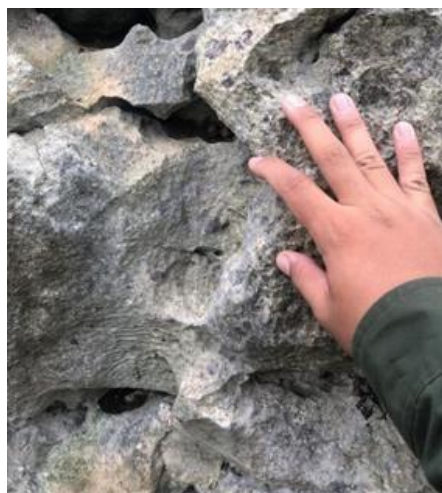
Gambar 5. Batu Gamping di Goa Lowo

Tabel 5 menjelaskan persentase berbagai kriteria atau standar yang digunakan untuk melakukan asesmen situs warisan geologi berdasarkan nilai ilmiah pada geosite Goa Lowo mencapai bobot 65%. Kriteria lokasi yang mewakili kerangka geologi adalah 22,5%, lokasi kunci penelitian adalah 5%, pemahaman keilmuan 2,5%, kondisi lokasi/situs geologi 11,25%, keragaman geologi 1,25%, keberadaan situs warisan geologi dalam satu wilayah 15%, dan hambatan penggunaan lokasi sebesar 7,5%.