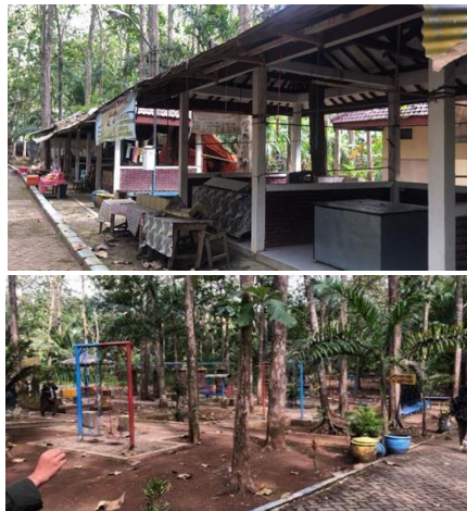
Gambar 9. Fasilitas Penunjang Pariwisata di Goa Lowo untuk Meningkatkan Kenyamanan Wisatawan

Pengembangan wisata minat khusus ini selain menciptakan alternatif pilihan bagi wisatawan, juga diharapkan mampu mendorong berkembangnya kawasan lain yang juga memiliki produk wisata yang spesifik serta membantu mengembangkan peluang-peluang usaha bagi masyarakat di sekitarnya. Selain itu, juga perlu adanya upaya memperkuat kemitraan melalui kesadaran bersama terhadap makna lintas batas untuk menciptakan ruang-ruang pariwisata baru.