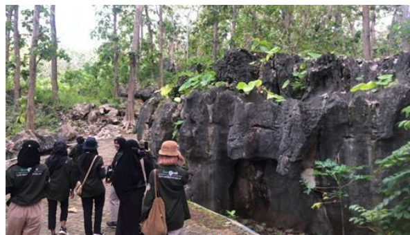
Gambar 6. Kunjungan Mahasiswa untuk Melakukan Penelitian pada Situs Goa Lowo

Tabel 6 menjelaskan persentase berbagai kriteria atau standar yang digunakan untuk melakukan asesmen situs warisan geologi berdasarkan nilai pendidikan pada geosite Goa Lowo mencapai bobot 72,5%. Nilai kerentanan pada geosite tersebut adalah 7,5%, aksesibilitas menuju lokasi geosite adalah 7,5%, hambatan pemanfaatan lokasi 2,5%, fasilitas keamanan yang terdapat pada geosite adalah 5%, sarana pendukung 3,75%, kepadatan penduduk 2,5%, hubungan dengan nilai lainnya 3,75%, status lokasi sebesar 3,75%, kekhasan 3,75%, kondisi pada pengamatan elemen geologi 10%, potensi informasi pendidikan/penelitian sebesar 15%, dan keanekaragaman geologi sebesar 7,5%.