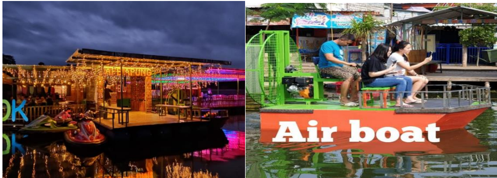
Gambar 3. Transformasi Café di Pedesaan

sambil menikmati senja di sore hari bersama kopi dan hidangan lainnya. Tetapi, disini juga menyediakan live music tradisional yang diiringi oleh alat tradisional berpadu dengan alat modern seperti gamelan, piano, dan gitar. Suasana music ini membuat pemuda menjadi betah untuk berlama-lama nangkring di café tersebut. Disisi lain, menu makan yang disajikan pun dengan harga yang begitu murah dan terjangkau di kantong para pemuda.