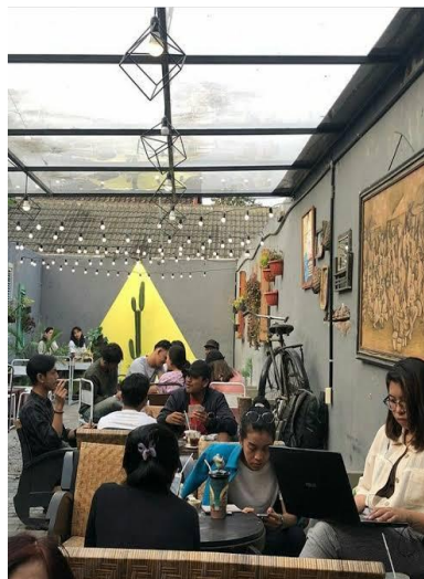
Gambar 1. Suasana Café di Perkotaan

Oleh karena itu, para pemuda yang berada di wilayah pedesaan juga masih dapat mengakses gaya hidup yang dapat disesuaikan dengan kemampuan mereka. Sedangkan di wilayah perkotaan para pemuda akan melakukan berbagai cara agar gaya hidup yang mereka inginkan dapat terpenuhi dan tetap eksis dalam nyangkruk di café-café mahal.