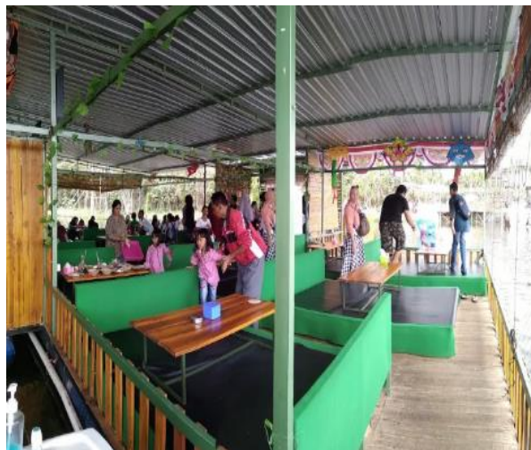
Gambar 2. Suasana Café di Pedesaan

Disisi lain, para pemuda yang melakukan nangkring di café lebih identic untuk memanfaatkan waktu luang mereka demi bertemu bersama teman dan mencari wifi gratis dan lebih main game. Selain itu, café di perkotaan juga lebih memberikan fasilitas live music, dimana terdapat music-music yang dihadirkan oleh pemilik kafe sebagai hiburan bagi para pendatang. Dan membuat interaksi antara individu dapat terjalin dengan baik meskipun tidak seperti di café yang ada di wilayah pedesaan. Hal ini dilakukan untuk meminimalisir individual yang dimiliki para pemuda yang condong berteman dan berinteraksi sesuai gaya hidup yang sama dan segerombolan teman dekatnya saja.