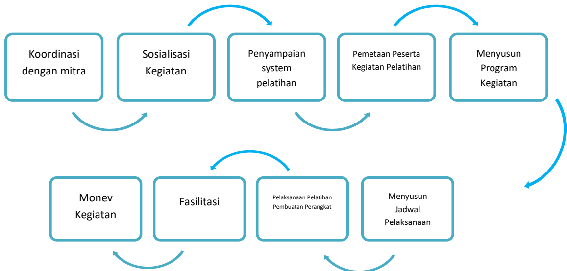
Gambar 1. Alur Pelatihan

Secara sederhana, alur pelatihan pembuatan perangkat pembelajaran yang mengintegrasikan keterampilan abad 21 bagi guru-guru yang berada di SMP Sriwedari, Yayasan Perguruan Sriwedari Malang dapat dipahami dengan skema berikut: