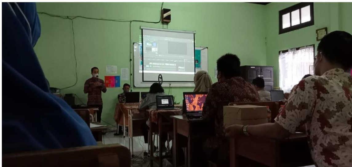
Gambar 2. Pemberian Materi oleh Narasumber

Dalam proses pelaksanaan kegiatan ini, guru diberikan keterampilan untuk mengembangkan pembuatan media pembelajaran interaktif dan editing video. Adapun aplikasi yang digunakan adalah aplikasi Camtasia Studio yang bisa mengedit video serta memberikan sebuah kuis online yang terdapat dalam fitur video.