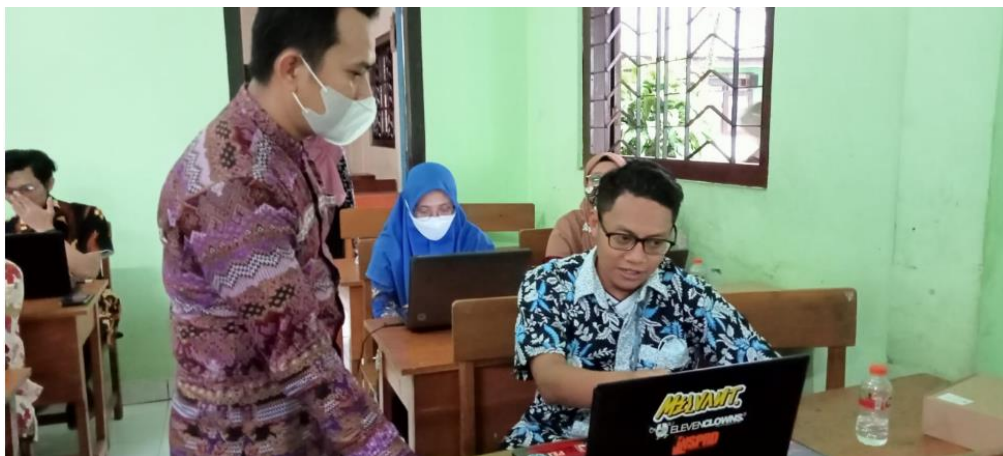
Gambar 3. Pendampingan Pembuatan Video Pembelajaran Kepada Peserta

Syihabuddin, dan Lusi Hidayanti. Peserta dalam kegiatan pelatihan ini sejumlah 20 orang yang terdiri dari guru-guru yang berada di Korwil 1 MKKS SMP Swasta Kota Malang yang memiliki semangat untuk ikut pelatihan.