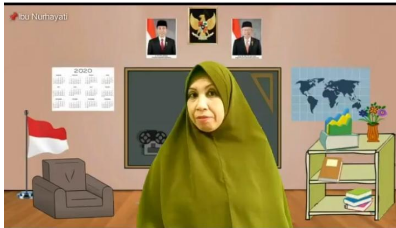
Gambar 5. Video Pembelajaran yang Mengintegrasikan Pendidikan Karakter