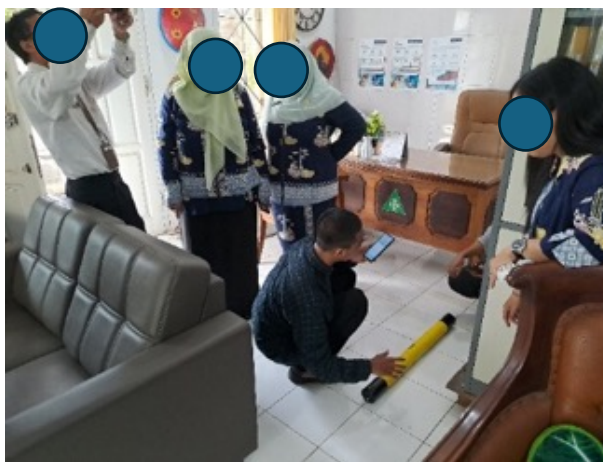
Gambar 8. Pengukuran ADMT di Ruang Kepala Sekolah

Pemanfaatan hasil survei Audio Magnetotelluric (ADMT) di sekolah membuka peluang integrasi antara sains geofisika dan pembelajaran sosial berbasis konteks lokal cagar budaya. Hasil contoh pengukuran resistivitas bawah permukaan di ruang Kepala Sekolah (Gambar 8) yang menunjukkan adanya anomali geofisika tidak hanya bernilai ilmiah, tetapi juga dapat dijadikan media belajar kontekstual yang relevan dengan budaya dan sejarah lingkungan sekolah. Dalam pembelajaran IPS secara terpadu, data ini mampu menumbuhkan keterampilan berpikir spasial, analitis, serta kesadaran pelestarian warisan budaya. Menurut Kristanti & Sujana (2022) media pembelajaran berbasis konteks lokal dapat meningkatkan keterlibatan peserta karena menampilkan fenomena nyata yang dekat dengan kehidupan mereka.