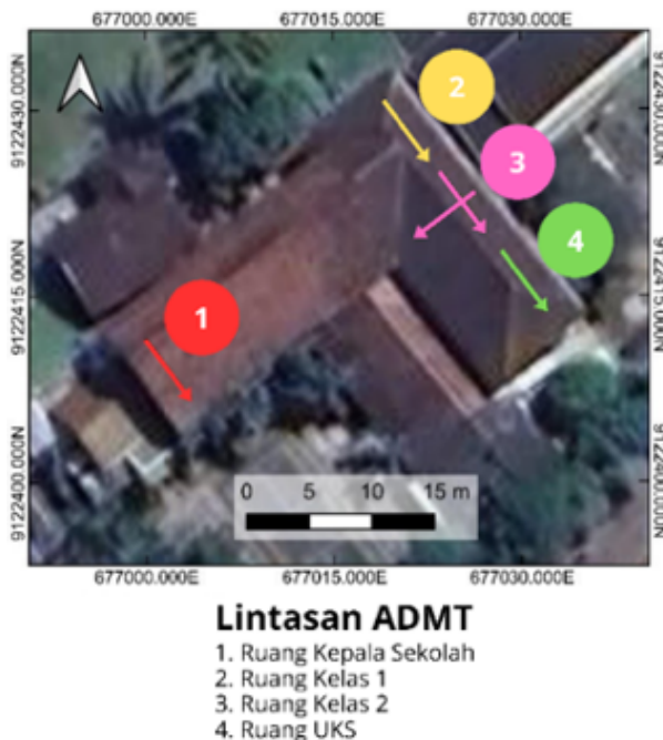
Gambar 2. Lintasan Pengukuran ADMT

Pemilihan kedalaman ini disesuaikan dengan dugaan posisi artefak dangkal yang mungkin tertimbun lapisan tanah vulkanik. Data mentah yang terekam berupa nilai resistivitas semu pada berbagai frekuensi elektromagnetik kemudian diolah menggunakan perangkat lunak pemodelan dua dimensi untuk menghasilkan penampang resistivitas bawah permukaan. Analisis dilakukan secara komparatif dan interpretatif, dengan mengaitkan hasil resistivitas, observasi lapangan, serta informasi narasumber. Analisis ini kemudian diinterpretasikan dalam bentuk pembelajaran untuk menumbuhkan kemampuan berpikir spasial dan kontekstual. Tahapan-tahapan tersebut menghasilkan data resistivitas bawah permukaan yang selanjutnya dianalisis untuk mengidentifikasi anomali geofisika yang berpotensi mengindikasikan keberadaan artefak batuan padat.