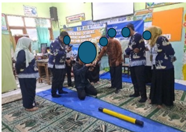
Gambar 9. Penggunaan ADMT sebagai Place-based Learning

Pendekatan Place-based Learning berangkat dari prinsip bahwa proses belajar menjadi bermakna ketika dikaitkan dengan pengalaman nyata di lingkungan sekitar. Kegiatan pembelajaran berbasis hasil survei ADMT di sekolah memberi ruang peserta untuk mengaitkan fenomena geofisika dengan sejarah lokal, khususnya keberadaan artefak Yoni sebagai representasi warisan masa Hindu-Buddha. Wardani dkk (2023) menegaskan bahwa pembelajaran berbasis konteks lokal mampu menumbuhkan pemahaman konseptual dan meningkatkan prestasi belajar karena siswa berinteraksi langsung dengan sumber belajar di lingkungannya. Dalam konteks ini, ADMT berperan sebagai penghubung antara Scientific Inquiry dan kearifan lokal yang memperkaya pengalaman belajar IPS.