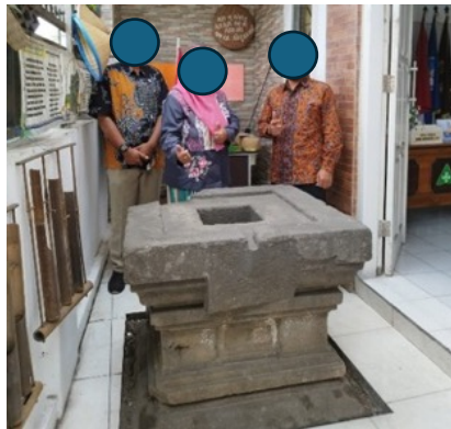
Gambar 1. Penemuan Yoni

Keberadaan artefak Yoni yang ditemukan di lingkungan sekolah dasar menjadi potensi lokal yang bernilai strategis sebagai sumber belajar autentik. Yoni sebagai peninggalan budaya masa Hindu-Buddha tidak hanya merepresentasikan jejak historis kawasan tersebut, tetapi juga menyediakan bukti material yang dapat dimanfaatkan untuk memperkuat pemahaman mengenai hubungan antara ruang, budaya, dan perkembangan peradaban. Artefak Yoni berperan sebagai penghubung langsung antara konsep abstrak IPS dan realitas yang dapat diamati, sekaligus membuka peluang bagi sekolah untuk mengintegrasikan pendekatan pembelajaran berbasis tempat dalam kegiatan belajar. Berdasarkan penelitian Anzelina (2023), menunjukkan bahwa pemanfaatan kearifan lokal dalam pembelajaran mampu memperkaya pemahaman konseptual dan meningkatkan rasa memiliki terhadap lingkungan.