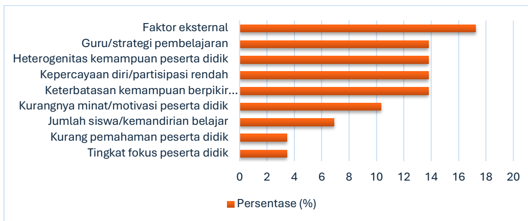
Gambar 2. Persentase Tantangan dalam Penerapan Strategi Pembelajaran Bahasa

Meskipun banyak guru menyatakan memahami konsep strategi pembelajaran, berbagai kendala masih dihadapi dalam penerapannya. Kendala tersebut dapat dilihat pada Gambar 2.