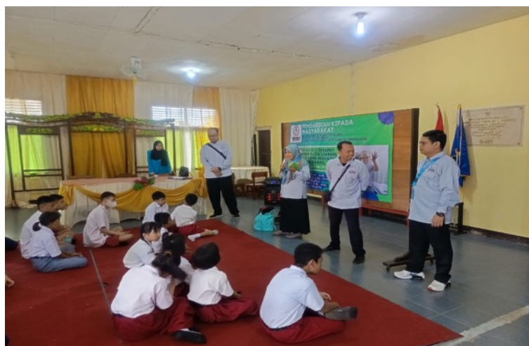
Gambar 4. Pemberian Pemahaman kepada Siswa tentang Art Terapi