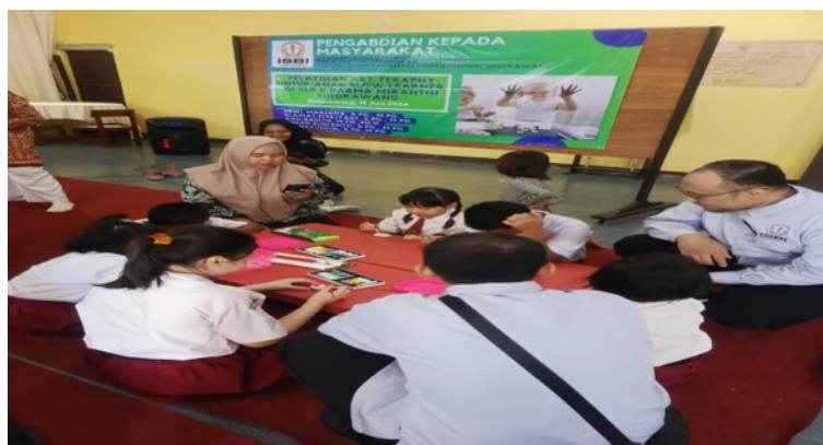
Gambar 5. Kegiatan Pelatihan

Dalam kegiatan pelaksanaan kegiatan diawali dengan penjelasan oleh tim pengabdian tentang cara pelaksanaan dan tujuan dari pelaksanaan kegiatan, setelah itu dilanjutkan dengan kegiatan pelatihan yang melibatkan guru dan tim pengabdian sebagai pihak pengarah dan pembimbing kegiatan. Fungsi dari tim pengarah dan pembimbing adalah untuk memastikan hal-hal yang dilakukan oleh siswa sesuai dengan arahan dan tujuan yang diharapkan.