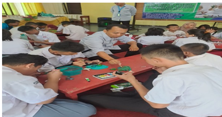
Gambar 6. Tes dengan Metode Finger Painting

Tahapan terakhir dari pelaksanaan pengabdian adalah Evaluasi Hasil. Tim bersama dengan guru SLB C Dharma Miranti memberikan tes menggunakan metode Finger Painting kepada siswa. Adapun tujuan dari tes ini adalah melihat kemampuan yang dimiliki siswa dalam memahami dan konsep mengenai warna sebagai salah satu lingkup perkembangan kognitif anak berkebutuhan khusus. Tahapan evaluasi hasil dilihat dari gambar 6.