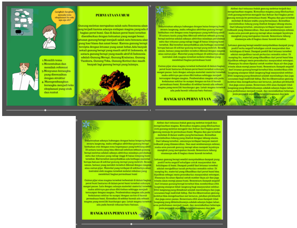
Gambar 2. Flipbook Setelah Masukan Ahli dan Uji Kelayakan

Berdasarkan hasil perolehan data di atas, uji ahli bahasa dan media dapat dinyatakan bahwa memperoleh kategori Sangat Layak dengan perolehan 91% dan 89% yang mana berada pada kategori Sangat Layak dengan antara perolehan skor 81%-100%. Perolehan skor ini juga tidak luput dari beberapa catatan yang diberikan oleh ahli berupa penyesuaian bahasa, gambar, dan latar belakang pemilihan warna yang lebih disesuaikan dengan karakter peserta didik kelas 5 SDN 01 Tegalgede yang memiliki semangat belajar tinggi dan memiliki ketertarikan dengan media teknologi. Berikut adalah gambaran flipbook setelah adanya masukan dari ahli dan dilakukan uji kelayakan: