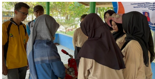
Gambar 5. Pelatihan PIN dan gantungan kunci di Pantai Mutiara Baru

Pocket book seperti Gambar 6 berisi penjelasan setiap Pantai Kerang Mas, Cemara Indah, Mutiara Baru, Keruju dan Indah Pelangi tentang lokasi, jam buka pantai, harga tiket masuk, daya tarik pantai, rute menuju pantai.