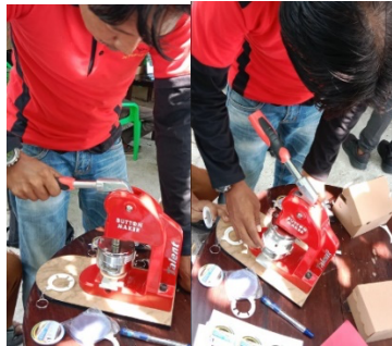
Gambar 4. Pelatihan PIN dan gantungan kunci di Pantai Kerang Mas

Aspek produksi ditingkatkan melalui pelatihan pembuatan PIN dan gantungan kunci. Pelatihan pembuatan PIN dan gantungan kunci telah dilakukan. Pelatihan telah dilakukan di Pantai Kerang Mas Seperti pada Gambar 4 dan pelatihan di Pantai Mutiara Indah seperti pada Gambar 5.