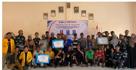
Gambar 3. Pelatihan WWP pada BUMDes Punjul Buana

Pelatihan dan implementasi pengelola BUMDes dilakukan secara efektif, dengan sekitar 25 peserta yang mengikuti pelatihan mengenai penggunaan website dan strategi promosi seperti pada Gambar 3.