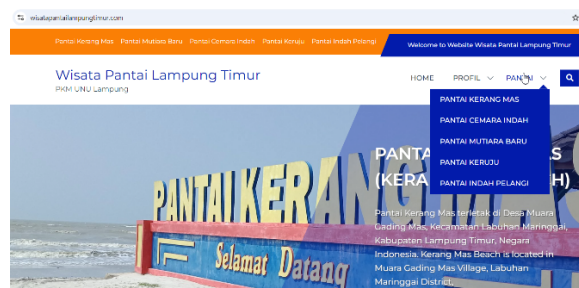
Gambar 1. Website Wisata Pantai (WWP)

Fitur-fitur utama seperti Home , Profil dan Pantai. Pada menu Pantai terdiri dari Pantai Kerang Mas, Pantai Cemara Indah, Pantai Mutiara Baru, Pantai Indah Pelangi dan Pantai Keruju. WWP dapat diakses pada link https://wisatapantailampungtimur.com dan digambarkan pada Gambar 1.