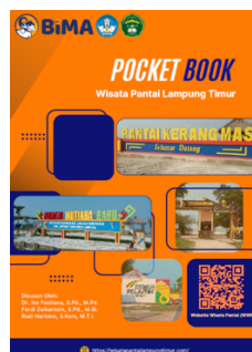
Gambar 6. Pocket book

Pocket book seperti Gambar 6 berisi penjelasan setiap Pantai Kerang Mas, Cemara Indah, Mutiara Baru, Keruju dan Indah Pelangi tentang lokasi, jam buka pantai, harga tiket masuk, daya tarik pantai, rute menuju pantai.