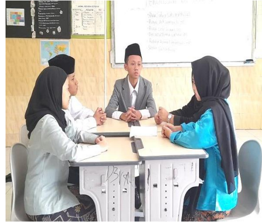
Gambar 1 dan 2. Peserta didik belajar mengolah emosi melalui metode bermain peran