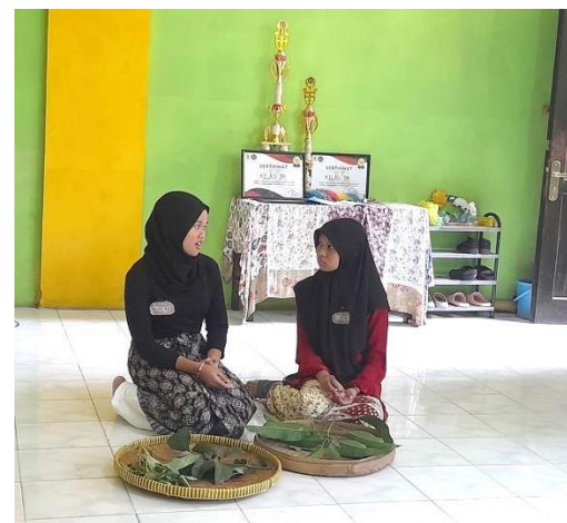
Gambar 3 dan 4. Peserta didik bertanggung jawab dalam menyiapkan kostum dan properti untuk bermain peran